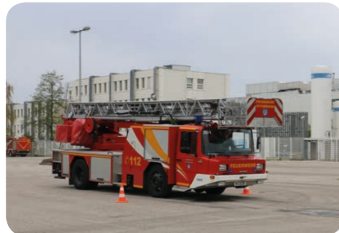
Vollbremsung: Bei den beiden Verkehrsleitkegeln steigt der Maschinist mit voller Kraft auf das Bremspedal.