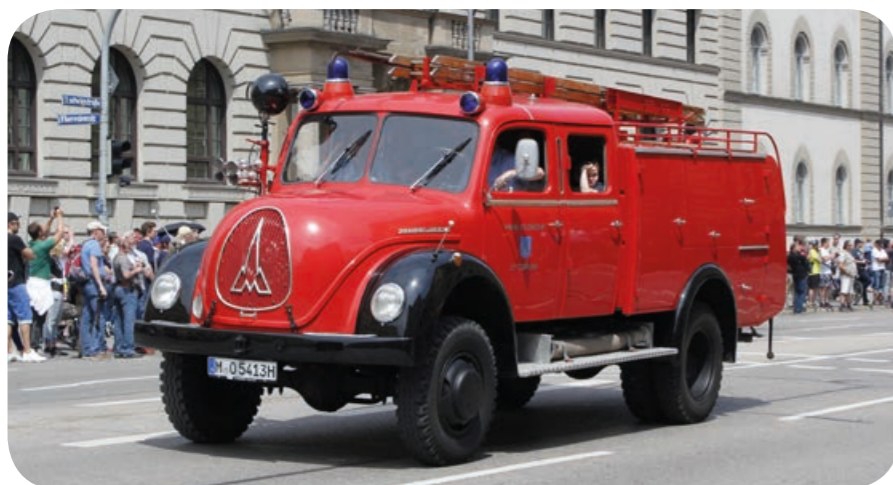
Ein Ottobrunner: Das 1958 gebaute Tanklöschfahrzeug auf der FIRETAGE Parade auf der Ludwigstraße.