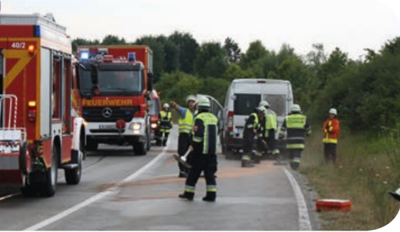
25 Meter: Die Spur aus Diesel und Öl, die der Kleintransporter nach dem Verkehrsunfall über die Ortsumgehung zog, wird mit Bindemittel abgekehrt.

Kaum hatten die Einsatzkräfte die Einsätze des nachmittäglichen Gewitters abgearbeitet, kam die Alarmmeldung zu einem Verkehrsunfall auf der Ortsumgehung. Vermutlich durch Blitzschlag war dort die Ampelanlage ausgefallen, und es kam zu einem heftigen Zusammenstoß von zwei