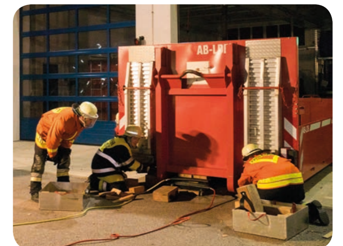
Technische Hilfeleistung: Die Kameraden heben mit Hebekissen die Mulde an und unterbauen diese mit Rüstholz.