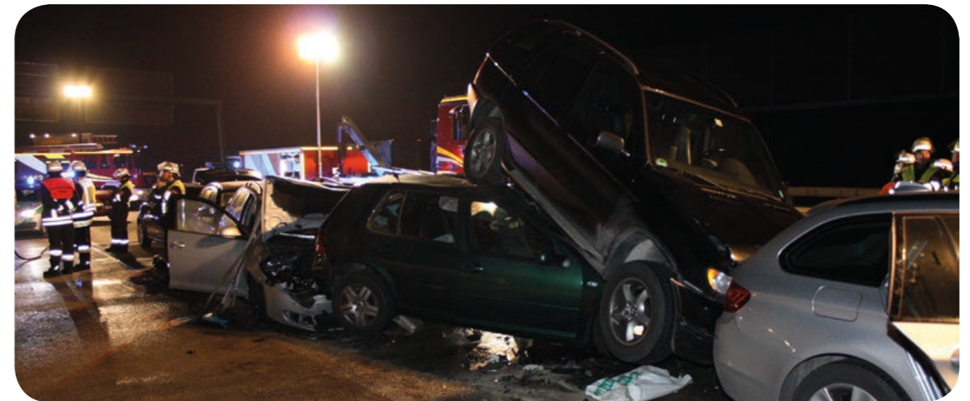
Auffahrunfall: Sieben Pkw waren vor dem Autobahnkreuz München-Süd in den Unfall verwickelt.

Spektakulär war der Anblick, der sich den Einsatzkräften bot, als sie an der Unfallstelle kurz vor dem Autobahnkreuz München-Süd eintrafen. Sieben Pkw waren aufeinander gefahren und hatten sich zum Teil übereinander getürmt. Alle Fahrer und Beifahrer konnten selber aus ihren Wracks aussteigen. Das ist ein großer Verdienst der konstruktiven Sicherheit im Fahrzeugbau. Wäre der Unfall etwa 20 Jahre früher passiert, dann wäre man vor einer größeren Anzahl eingeklemmter und schwer verletzter Personen gestanden. So sammelte man am Einsatzleitwagen alle betroffenen Personen. Die First Responder, weitere Einsatzkräfte und der Rettungsdienst sicherten die Personen auf Verletzungen. Drei