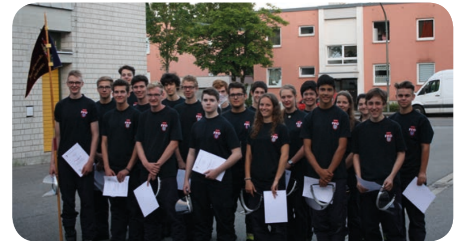
Bestanden! 19 Kameraden aus Ottobrunn und eine Kameradin aus Sauerlach wechseln von der Jugendfeuerwehr in den Einsatzdienst.

Die Feuerwehr Ottobrunn bezieht den größten Teil ihrer Einsatzkräfte aus der eigenen Jugendarbeit, daher freut es uns stets sehr, wenn sich engagierte Jugendliche für das Hobby Feuerwehr entscheiden. Eine personalstarke und schlagkräftige Wehr trägt zur Sicherheit der Gemeinde Ottobrunn bei.