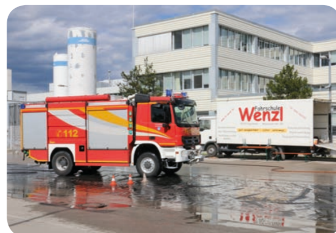
Herausforderung: Letzte Übungsaufgabe war das Ausweichen vor einem Hindernis auf der nassen, glatten Folie.