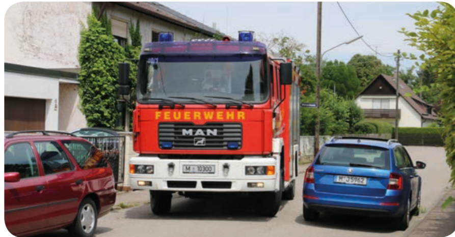
Zu geringer Abstand: Die Pkw's parken versetzt, aber ihre Fahrer haben zu wenig Platz gelassen für ein breites Einsatzfahrzeug.

Parken Sie immer so, dass ausreichend Platz für Einsatzfahrzeuge bleibt – mindestens 3 Meter zur Seite.