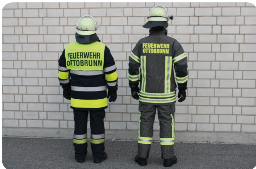
Im Vergleich von hinten: Die neue kürzere Jacke ist bequemer und leichter als der bisherige lange Mantel. Der gelbe Koller mit der Aufschrift entfiel.

Geplant ist, insgesamt etwa 160 Sätze anzuschaffen, um jederzeit Kleidung zum Tausch anbieten zu können. Denn nach jedem Einsatz, bei dem die Kleidung mit Rauch beaufschlagt oder schmutzig wird, geht sie in die Reinigung. Etwa 1000 Euro sind zu veranschlagen für die Beschaffung eines kompletten Satzes der Schutzkleidung. Die Kosten hierfür trägt zum Großteil die Gemeinde Ottobrunn. Aus finanziellen Gründen wird sich die Beschaffung über mehrere Jahre hinziehen. Der Feuerwehrverein beteiligt sich daran mit 30.000 Euro. Fördermittel und Spenden werden somit eingesetzt, um die Einsatzkräfte mit einer neuen Kleidung optimal vor den Gefahren an der Einsatzstelle zu schützen.