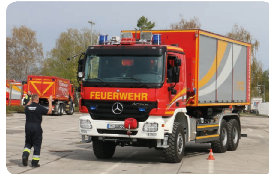
Rückwärts: Mit Handzeichen unterstützt der Einweiser das Rangieren durch eine Slalomgasse.

Nur wer ankommt kann helfen! Eine Alarmfahrt unterscheidet sich von einer „normalen“ Fahrt mit dem Personenwagen. Die Abmessungen der Einsatzfahrzeuge sind größer. Sie müssen oft unter engen Platzverhältnissen rangiert werden. Eng verparkte Siedlungsstraßen oder eine nur mangelhaft gebildete Rettungsgasse auf der Autobahn stellen eine Herausforderung dar. Blaulicht und Martinshorn sorgen bei anderen Verkehrsteilnehmern für hektische und unvorhersehbare Reaktionen. Der Maschinist am Steuer des Feuerwehrfahrzeuges muss immer auf Brems- und Ausweichmanöver vorbereitet sein. Deshalb ließ die Ottobrunner Feuerwehr an vier Samstagen insgesamt 48 Maschinisten schulen. Der Unterricht war sehr praxisbezogen, denn die Mitglieder