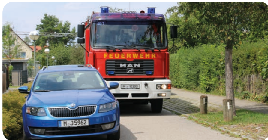
Zu eng: Zwischen dem geparkten Auto und der Bauminsel sind weniger als 3,05 Meter. Die Straße ist für die Feuerwehr blockiert.

Seit 30 Jahren ist uns kein Weg zu weit und kein Garten zu groß!