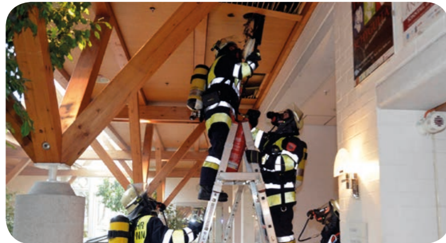
Löschen: Nachdem die Atemschutzkräfte eine Bockleiter gebaut haben, bekämpfen sie den Brand mit einem Kohlendioxidlöscher.

Wenn der Räumungsalarm ertönt, verlassen Sie bitte umgehend das Gebäude!