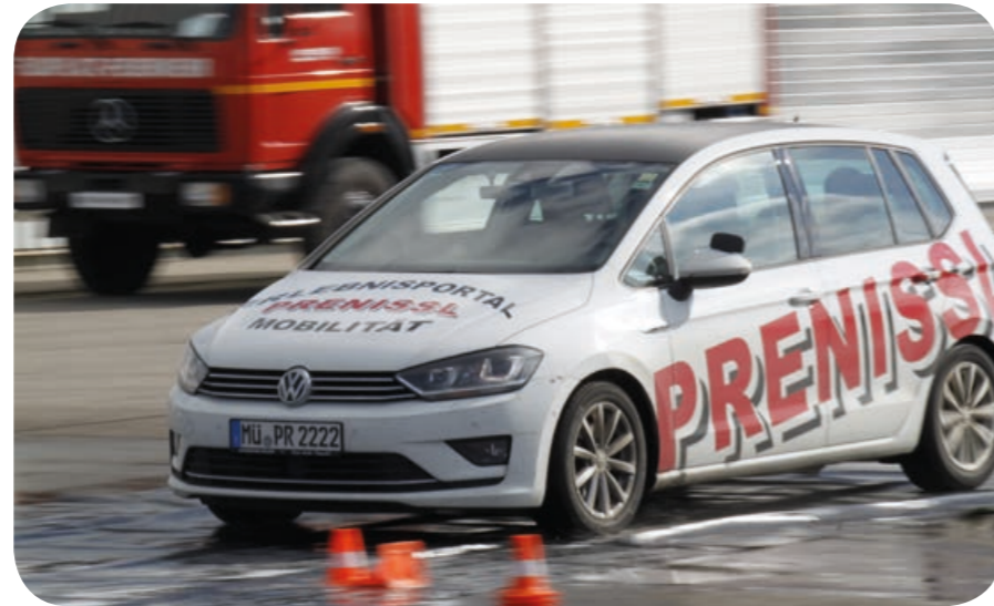
Beherrschung: Bremsen und Ausweichen auf einer nassen Fahrbahn.

Beim Bremsen auf trockener und nasser Fahrbahn spielt die Fahrphysik eine wich-