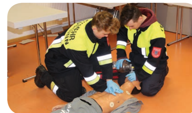
Koordination: An einer Übungspuppe wird die Herz-Lungen-Wiederbelebung geübt. Abwechselnd 30-mal drücken dann zweimal beatmen.