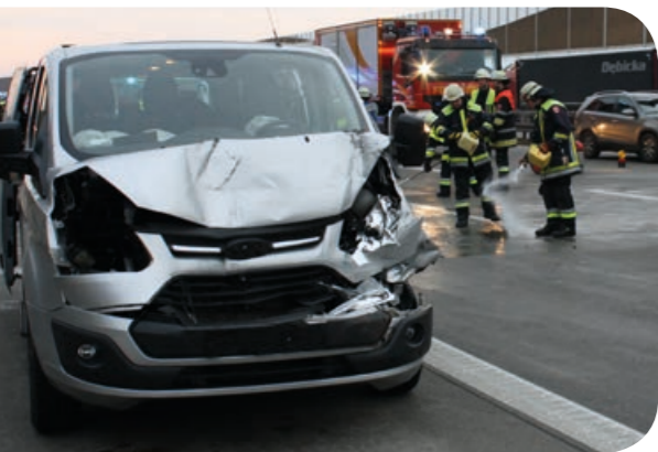
Ölspur: Mit Ölbindern streuen die Einsatzkräfte die ausgelaufenen Flüssigkeiten ab.

Ein Großaufgebot schickte die Feuerwehrsatzzentrale an diesem Samstagmorgen auf die Autobahn, denn die Notrufe ließen eine Massenkarambolage mit vielen Verletzten befürchten. Die Feuerwehren Ottobrunn und Hohenbrunn, Mitglieder der Kreisbrandinspektion und der Rettungsdienst fuhren auf der A 99 in Richtung Autobahnkreuz München-Süd.