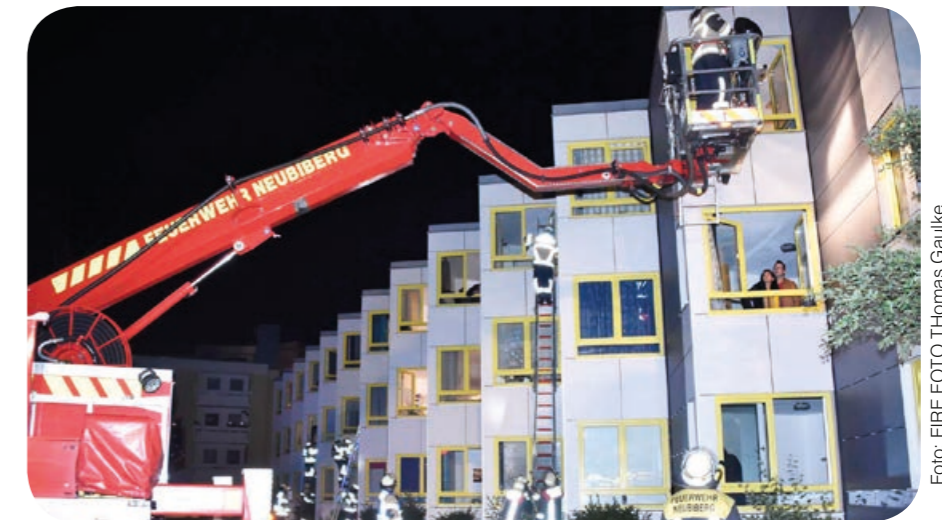
Zusammenarbeit: Der Teleskopgelenkmast der Neubiberger Feuerwehr kam ebenfalls zum Einsatz.