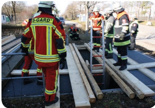
Rahmenbau: Bohlen und Kanthölzern sind um die Unglückstelle ausgelegt. Über die Steckleiter ist eine Einsatzkraft zur Betreuung des Verschütteten in die Grube eingestiegen.

Die Erkenntnisse dieses Ausbildungstages haben die Dienstgrade im vergangenen Jahr an sechs Übungsabenden an die Einsatzkräfte weitergeben. Bei der Alarmmeldung „Tiefbauunfall“ rückt zur Ergänzung vom Hilfeleistungslöschfahrzeug HLF 20 und dem Wechsellader mit Abrollbehälter Rüst das zweite Wechselladerfahrzeug mit dem Abrollbehälter Rüstholz aus. Dessen Beladung wird nun noch besser auf diese, hoffentlich sehr seltene Aufgabe ausgelegt sein.