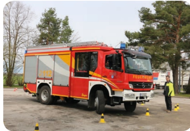
Wendemanöver: Fahrlehrer Wenzl beobachtet, wie die Kameradin das LF 20 auf engstem Platz wendet.

Auf dem Parkplatz der Firma Airbus übten die Ottobrunner unter Anleitung einer Fahrlehrerin und eines Fahrlehrers das Rangieren, Einweisen und Abschätzen ihrer Fahrzeugabmessungen. Die richtige Sitzposition und die passende Lenkradeinstellung wurden als Grundlagen für die Fahrzeugbeherrschung besprochen. Als nächstes stand Slalomfahren bei unterschiedlichen Geschwindigkeiten auf dem Programm. Dem folgten Bremsmanöver. Die beregnete Folie als Ersatz für Regen verdeutlichte die bekannte Tatsache, dass sich der Bremsweg auf feuchter Fahrbahn verlängert. Als Höhepunkt des Tages empfanden die Teilnehmer die Brems- und Ausweichmanöver auf dieser glatten Folie.