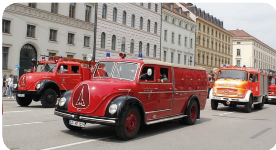
Drei aus dem Landkreis: Diese Tanklöschfahrzeuge liefen früher in Grünwald (vorne), Ottobrunn (links daneben) und Hohenbrunn (rechts)

150 Jahre feierte die Feuerwehr München im Mai 2016 mit der weltweit größten Parade an Feuerwehrfahrzeugen, die es bislang gegeben hat. 200 moderne Fahrzeuge der Freiwilligen Feuerwehr, der Berufsfeuerwehr sowie der Werkfeuerwehren und Hilfsorganisationen in München eröffneten die Parade. Dem folgten 238 Feuerwehr-Oldtimer aller Epochen. Somit übertraf die FIRETAGE Parade deutlich den bisherigen Weltrekord einer amerikanischen Feuerwehr, der bei 220 Teilnehmern lag. Ein Teilnehmer kam aus Ottobrunn: Das 1958 gebaute TLF 16 auf Magirus Mercur 125 A gehört heute zur Fahrzeugsammlung der rundhauberfreunde.de. Aus deren Fuhrpark starteten sieben Fahrzeuge in den verschiedenen thematischen Blöcken auf die etwa sieben Kilometer lange Strecke. Von der Leopoldstraße in Höhe der U-Bahn-Station Giselastraße bis zur Ehrentribüne am Odeonsplatz säumten laut Schätzungen der Veranstalter 52.000 Besucher die Festzugstrecke. Auf dem Altstadtring zog die Oldtimerkarawane einmal um die Münchner Altstadt und stellte sich dann bei Kaiserwetter auf der Ludwigstraße, dem Odeonsplatz und dem Wittelsbacher Platz zur Besichtigung auf. Das Buch zur Parade vom Organisator Markus Zawadke: (M)eine FIRETAGE-Parade. Erhältlich im Shop von www.mietoldtimer.de .