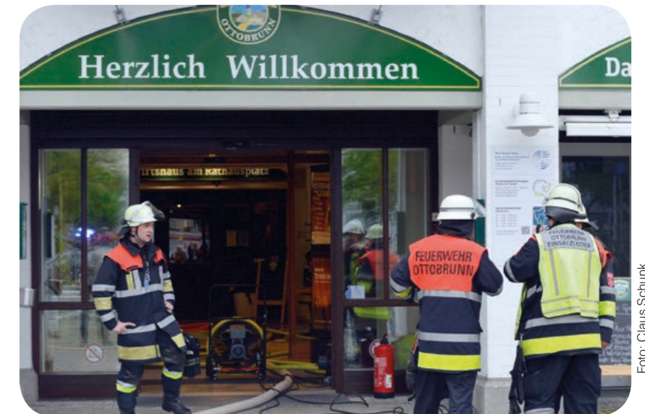
Einsatz im Wolf-Ferrari-Haus: In der Eingangshalle steht der Hochleistungslüfter und Schläuche ziehen sich ins Treppenhaus.

Die um 19.06 Uhr alarmierte Ottobrunner Feuerwehr traf bereits nach vier Minuten am Rathausplatz ein. Sie konnte so schnell ausrücken, weil sich ein Teil der Einsatzkräfte um 19.00 Uhr zu einer Ausbildung im Gerätehaus getroffen hatte. Unter Atemschutz löschten sie mit Kohlendioxidlöschern den Brand an der Lampe und den Stromkabeln, um Folgeschäden durch Löschwasser zu vermeiden. Zur Kontrolle der Ausbreitung der Flammen öffneten sie die hölzerne Deckenverkleidung, entfernten das Dämmmaterial und bekämpften den Brand im Zwischendeckenbereich. Die anschließende Kontrolle mit der Wärmebildkamera ergab, dass man den Brand gerade noch rechtzeitig im Entstehen bekämpfen konnte. Etwas länger brauchten die Einsatzkräfte, um den