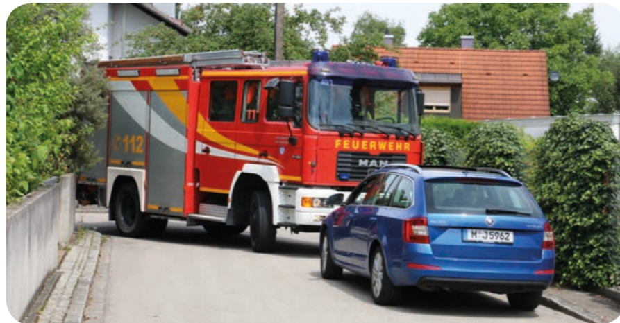
Zu nah an der Kreuzung: Das Einsatzfahrzeug kommt nicht um die Kurve herum.