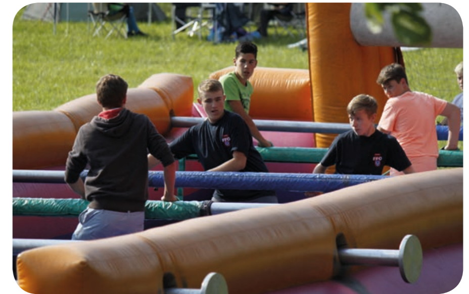
1:0 für Ottobrunn: Volle Action im Menschenkicker!

Am Samstag trafen sich die Jugendfeuerwehren des Landkreises am Feuerwehrgerätehaus Unterschleißheim zum alljährlichen Jugendwettkampf. An zehn Stationen galt es bei einer Spaßolympiade Aufgaben zu meistern. Dazu gehörten der Kastenlauf und das Zielspritzen mit der Kübelspritze. Aber auch die Kreativität war