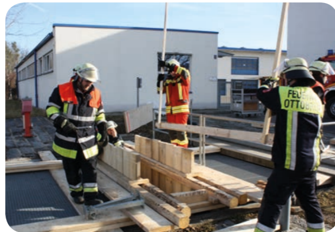
Senkrechter Verbau: Die Bohlen sind im Rahmen eingeschoben. An Dachlatten befestigt können die Brusthölzer an ihrer vorgesehenen Stelle herabgelassen werden.