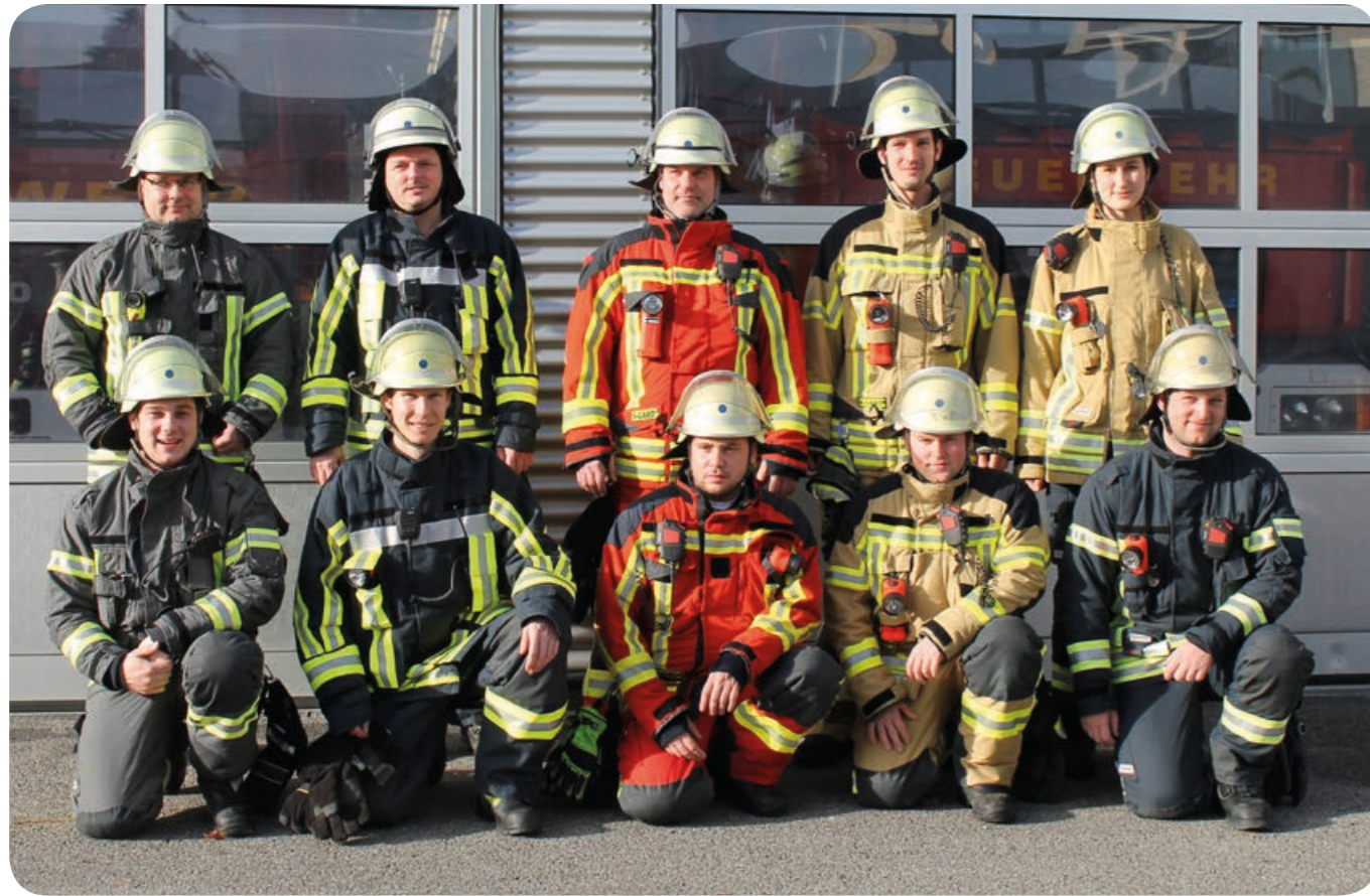
Testphase: bevor die Entscheidung zur Beschaffung fiel, mussten sich fünf verschiedene Schutzkleidungen bei einigen Tests beweisen.

Im November 2016 erhielten 45 Atemschutzgeräteträger ihre neue Schutzjacke und die Einsatzhose. Denn diese Einsatzkräfte sind es, die in Hitze und Rauch eintauchen, und sie brauchen den besten Schutz, den man ihnen bieten kann. Die restlichen Kameradinnen und Kameraden werden im Lauf der nächsten Jahre ausgestattet werden.