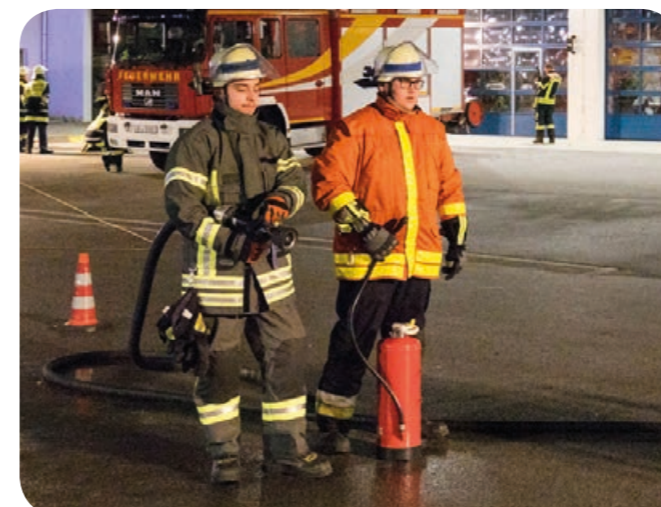
Brandschutz: Mit einem Pulverlöschers und dem Schnellangriff stehen zwei Kameraden in Bereitschaft bei den Rettungsarbeiten an dem Pkw.

Die Ottobrunner Feuerwehr beteiligte sich an dem diesjährigen MTA-Ausbildungszyklus mit neun Ausbilder.