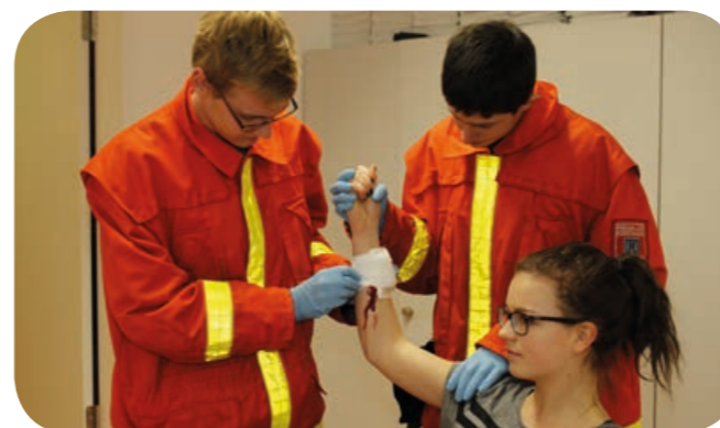
Teamwork: Um die Blutung zu stoppen, hält ein Feuerwehrmann den Arm hoch und drückt ihn ab. Der andere legt den Druckverband an.

mit den verschiedenen Krankentragen, die von der Ottobrunner Feuerwehr eingesetzt werden. Mehrmals im Jahr benötigt der Rettungsdienst die Unterstützung durch die Feuerwehr mit der Drehleiter, um einen Patienten schonend aus einem oberen Stockwerk zu Boden zu bringen. Deshalb stellte der Rettungsdienst den Jugendlichen seine Stryker-Trage vor, mit denen die standardisierten Bayern-RTW des Rettungsdienstes ausgerüstet sind.