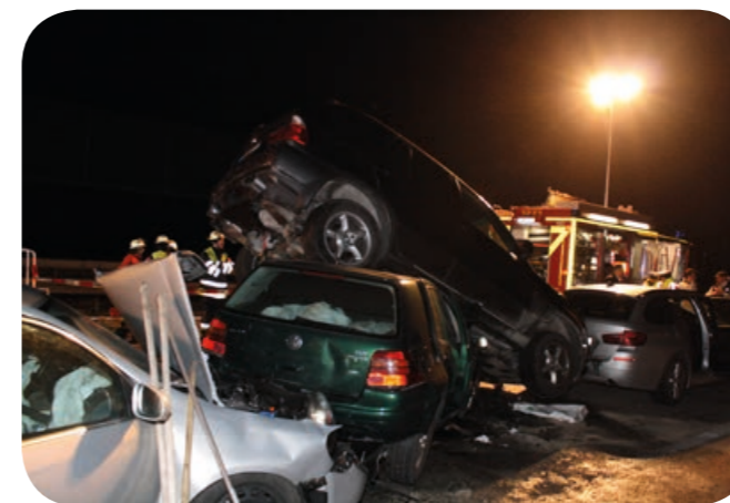
Brandausbruch: Der grüne Pkw fing an zu rauchen. Das Feuer konnte sofort bekämpft werden.

Die Kfz-Prüfstellen mit Sympathie und Sachverstand.