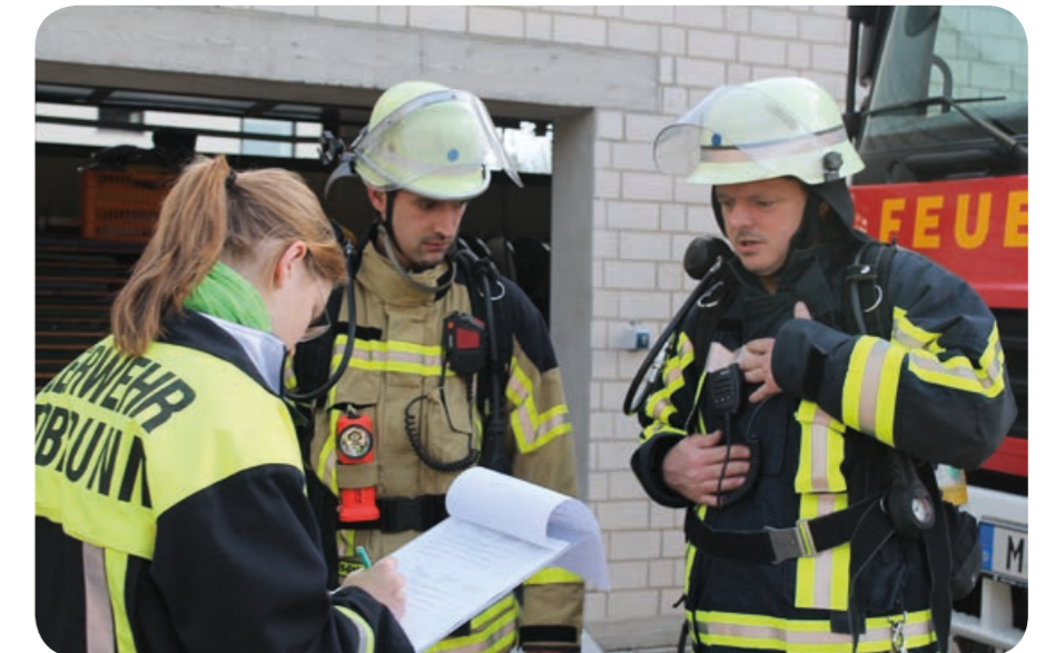
Bewertung: Jeder Kandidat für eine neue Schutzkleidung wurde nach jeder Station von den Trägern bewertet.

Nach Auswertung aller Tests fiel die Entscheidung auf das Modell Fire Breaker Action X-TREME mit dem IB-TEX-Gewebe der österreichischen Firma Texport. X-TREME steht für den vierlagigen Aufbau der Schutzkleidung. Der Hersteller führt aus, dass so mehr Schutz vor dem Durchschlagen der Hitze bei einem Innenangriff und zugleich ein besserer Tragekomfort geboten wird, als für die Erfüllung der europäischen Norm EN 469 gefordert ist. Das grau-melierte IB-TEX-Gewebe ist ein Polyamidgewebe (Aramid / Nomex mit Carbonfaseranteil). Selbst nach etlichen Waschgängen bleiben Formstabilität und Farbe erhalten.