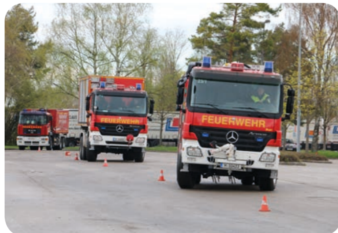
Wedelkurs: TLF 24/50 und die beiden Wechsellader bei der Fahrt durch die Slalomstrecke.