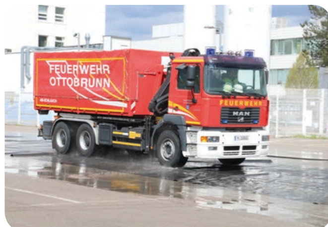
Nass: Der Bremsweg verlängert sich auf der beregneten glatten Folie.