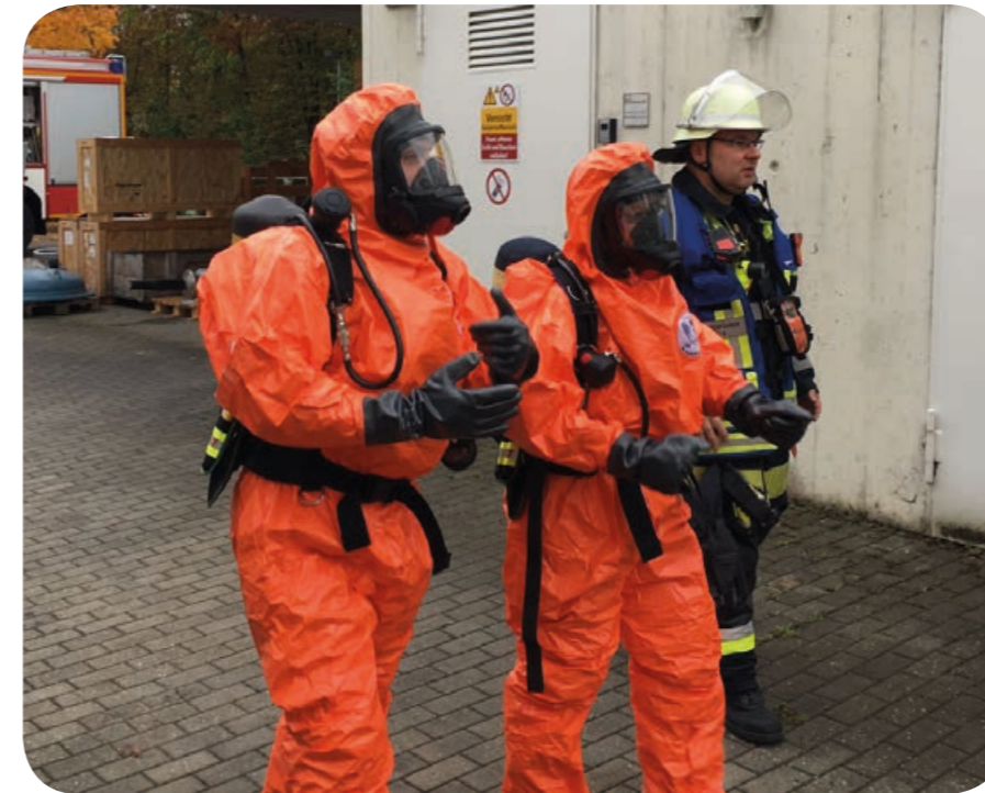
Geschützt: Spritzschutzkleidung, Gummihandschuhe und Pressluftatmer legten die beiden Einsatzkräfte an, um das Chemiefass zu sichern.

Wenn geregelte Abläufe aus dem Ruder laufen, wird nach der Feuerwehr gerufen. So wie bei einem Fass mit Chemikalien. Mitarbeiter eines Industriebetriebs entdeckten in ihrem Gefahrgutlager ein Metallfass, dessen Deckel sich kräftig aufgebläht hatte. Handschriftlich war der Inhalt mit „Phosphorsäure“ angegeben. Es fehlten die vorgeschriebenen Warnzettel