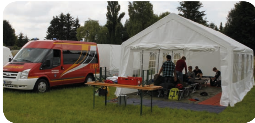
Mit allem Komfort: Die Ottobrunner Jugendlichen stellten ihr Zelt mit Feldbetten, Licht, Heizung und Fußboden aus.

gefragt: Beim Activity stellten die Jugendlichen Begriffe aus der Feuerwehr zeichnerisch oder pantomimisch dar. Am Schluss stand auf der Urkunde der Ottobrunner „11. Platz“. Damit reichte es