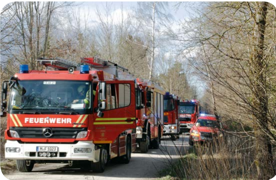
Feuerwehrfahrzeuge aus München, Ottobrunn und Putzbrunn trafen sich am 04.04.2018 bei einem Waldbrand in Waldperlach.

Feuermelderalarme zum Anlass. Unter den Begriff „Feuermelder“ fallen neben Brandmeldeanlagen in Gewerbegebäuden oder öffentlichen Einrichtungen immer öfters die privaten Heimrauchmelder. Dabei haben die meisten Feuermelder genau das getan, was sie tun sollen: Eine Rauchentwicklung gemeldet. Auch wenn dieses oftmals „nur“ ein angebranntes Essen war, jeder Brand beginnt klein und hätte sich ohne frühzeitiges Eingreifen der Feuerwehr ausweiten und Menschenleben in Gefahr bringen können. In das Klagegeld mancher Wehren, dass ihre Einsatzbelastung wegen grundloser Heimrauchmelderauslösungen gestiegen sei, möchte die Ottobrunner Wehr nicht einstimmen. Im Gegenteil: Heimrauchmelder sind Lebensretter! Mehrfach hörten Nachbarn das Piepsen und wählten den Notruf 112. Die Feuerwehr entdeckte dann im Rauch liegende oder schlafende Personen und konnte sie in Sicherheit bringen bevor sie noch größere gesundheitliche Schäden erlitten hätten.