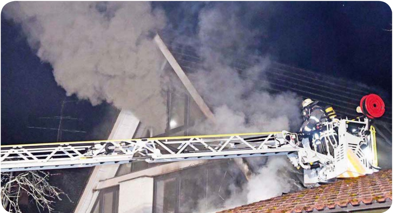
Die Löscharbeiten im Innenangriff und von der Drehleiter am 01.01.2018 begrenzten das Feuer auf die Räume im 1. Stock und dem Dachgeschoss.