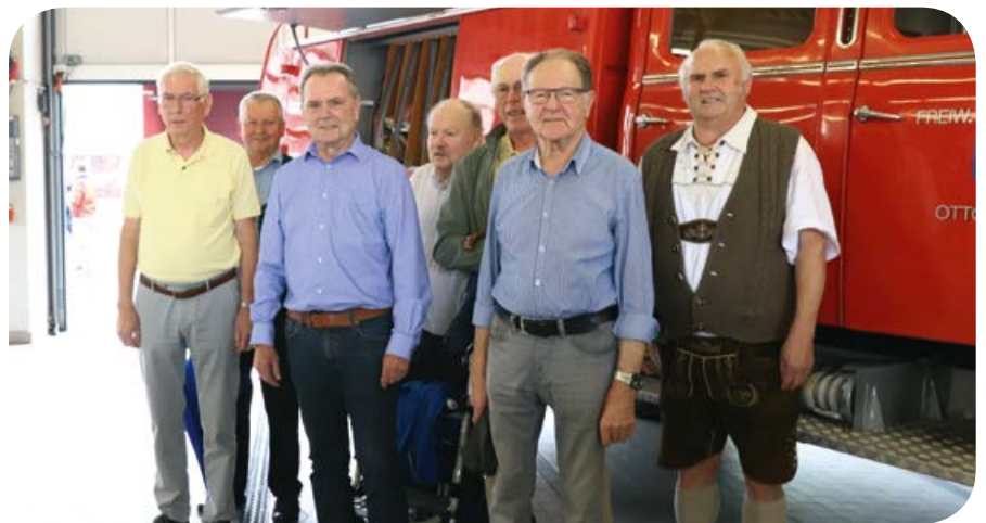
Als besondere Gäste besuchten sieben der acht damaligen Jugendlichen der 1. Jugendgruppe von 1958 den Kreisjugendfeuerwehrtag.

Am 31.05.1958 fand die erste Übung der neu gegründeten Jugendfeuerwehr mit acht jungen Burschen statt. Vor 60 Jahren zählte Ottobrunn etwa 6000 Einwohner. Trotz steigender Einwohnerzahlen durch die sehr rege Bautätigkeit lag die Zahl der Einsatzkräfte mit 35 auf recht niedrigem Niveau. Die Führungskräfte legten mit dem Aufbau einer Jugendfeuerwehr den Grundstein für eine bis heute anhaltende Erfolgsgeschichte. 71 Prozent der Einsatzkräfte der Wehr im Jahr 2018 haben ihre Feuerwehrgrundausbildung bei der eigenen Jugendfeuerwehr durchlaufen. Es ist keine Wehr bekannt, die sich im Großraum München bereits so frühzeitig und so