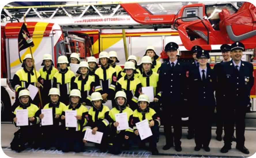
Bestanden: Stolz zeigten die 18 Jugendlichen ihre Urkunden der Jugendleistungsprüfung.