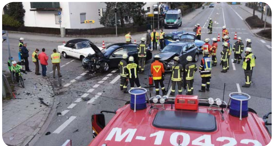
Erster Einsatz am 04.04.2018 auf der Kreuzung Haidgraben und Unterhachinger Straße. Drei Pkw waren in den Unfall verwickelt.

Feuerwehr versorgte die Verletzten und half ihnen aus den Wracks heraus. Kurios mutet die Ursache für den Defekt der Ampel an. Heftiger Ameisenbefall hatte in der Elektrik im Ampelmast für einen Kurzschluss gesorgt.