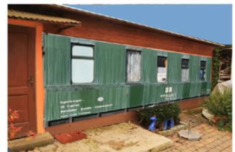
Reichsbahn-Idylle im Wald.

Wußten Sie , dass 1910 ein Waggon der Reichsbahn im Wald von Ottobrunn abgestellt wurde. Der steht immer noch, nur ist er verkleidet als Wochenendhäuschen.