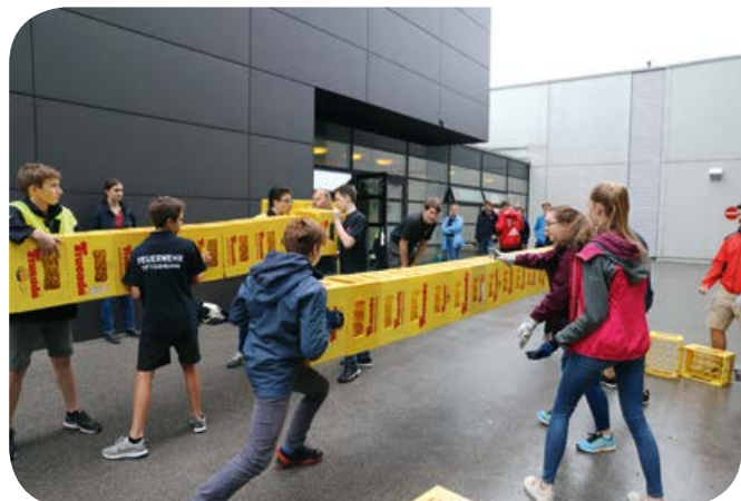
Ein beliebtes und traditionelles Spiel am Kreisjugendfeuerwehrtag: Kistenstapeln, aber waagrecht!