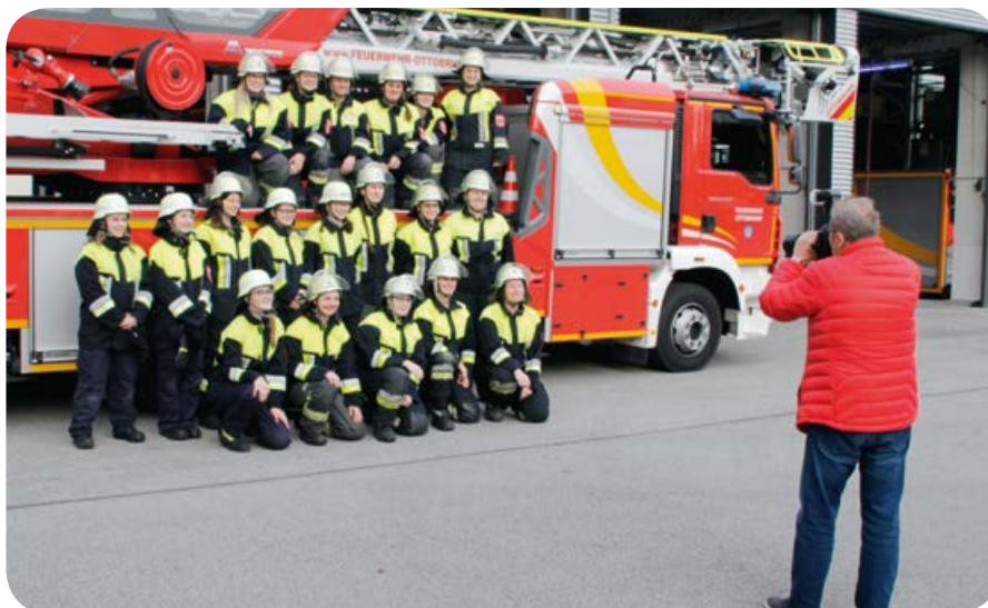
Für die Süddeutsche Zeitung kam Fotograf Claus Schunk bei einer Hauptübung vorbei und machte ein Gruppenfoto der anwesenden Kameradinnen.

Einen ganzen Tag lag war das BR Fernsehen im September für ihre Sendung „Heimat der Rekorde“ zu Gast im Gerätehaus. Das Team bestand aus Kameramann, Tontechniker, Regisseur, Maskenbildnerin und Moderatorin Claudia Pupeter. Zwei Kameradinnen führten die Moderatorin in die Aufgaben der Feuerwehr ein. Sie durfte unter Anleitung mit dem Rettungsspreizer und der Rettungsschere einen Personenwagen zerschneiden und stellte fest, dass die Arbeit bei der Freiwilligen Feuerwehr für Frauen und Männer gleich leicht zu machen ist. Der acht Minuten lange Beitrag lief in der Sendung vom 11.02.2019 und lässt sich in der BR Mediathek unter dem Titel „Heimat der Rekorde“ ansehen. BR PULS hat den Beitrag aus dem BR Fernsehen über die Frauen bei der Ottobrunner Feuerwehr aufgegriffen und daraus eine Kurzfassung von 1:53 Minuten Länge gemacht.