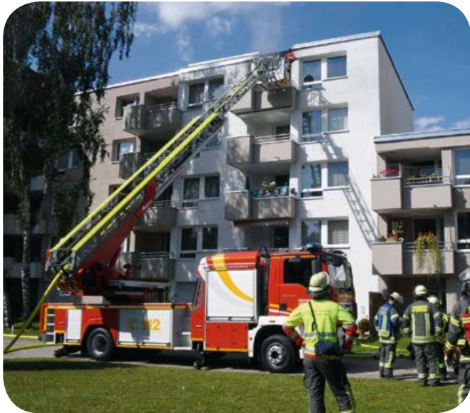
Die Brandbekämpfung am 21.09.2018 lief auf der Südseite der Häuserzeile am Albertus-Magnus-Weg über die Drehleiter.