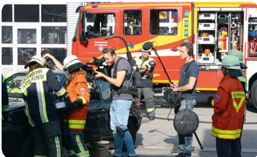
Das BR Fernsehen drehte einen ganzen Tag lang bei der FF Ottobrunn für ihre Sendung „Heimat der Rekorde“.