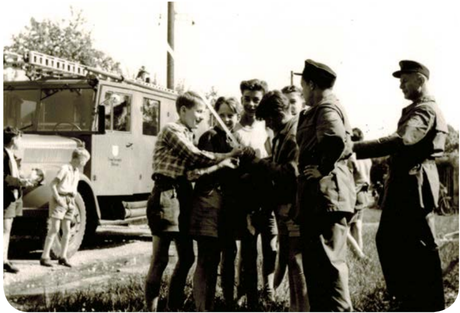
Die erste Ausbildung der Jugendfeuerwehr fand im Mai 1958 statt. Noch gab es keine Schutzkleidung, aber die Burschen waren mit Eifer und viel Spaß dabei.

Anlässlich des 60. Gründungsjubiläums ihrer Jugendfeuerwehr fand am 21.07.2018 der Kreisjugendfeuerwehrtag in Ottobrunn statt. Jede der 19 Mannschaften setzte sich aus fünf bis acht Jugendlichen und einem Betreuer zusammen. Bei Kastenlauf, Golfen, Leinenzielwurf, Balllauf, Schwammwerfen, Schlauchkegeln, Spritzenmeister, Palettenzug, Kastenquerstapeln und Luftballonpyramide hatten die etwa 200 Jugendlichen trotz Regen und kühlem Wetter viel Spaß und sammelten eifrig Punkte. In der Schlussabrechnung durften die Pullacher den Pokal für den 1. Platz mitnehmen. Höhenkirchen kam auf den 2. Platz, Neuried auf den 3. Platz. Die drei Mannschaften des Gastgebers belegten den 6., 11., und 16. Platz.