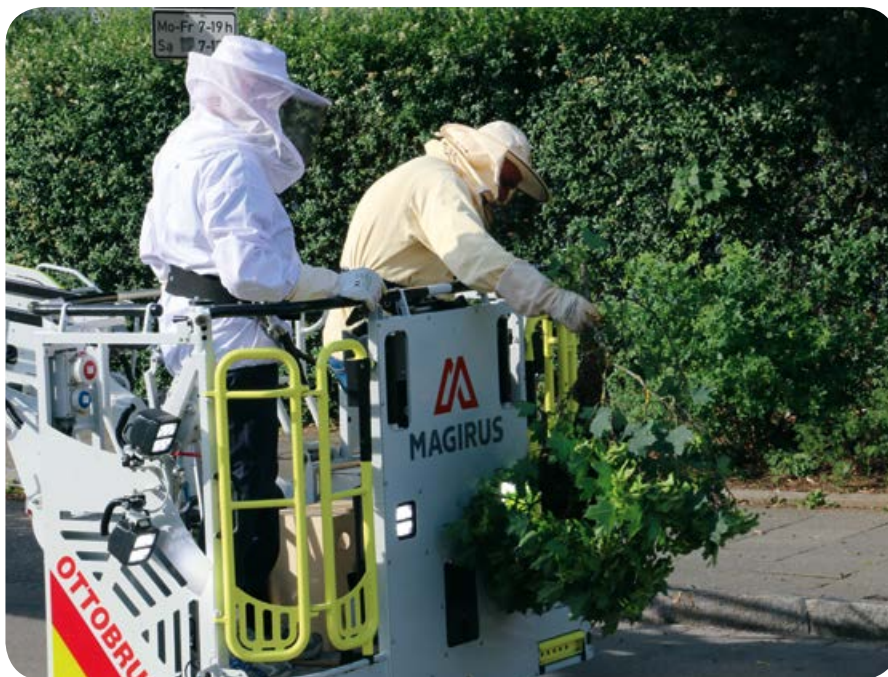
Die Feuerwehr unterstützte am 03.06.2018 zwei Imker mit der Drehleiter, um einen am Ast sitzenden Bienenschwarm einzufangen.

Seltener als von der Bevölkerung vermutet, führen die Einsätze auf den Autobahnring A 99. Am Abend des 09.01.2018 musste man die Unfallstelle jedoch längere Zeit suchen. An angegebenem Ort „Auffahrt Ottobrunn“ war nichts zu sehen. Einen verunfallten BMW fand man dann