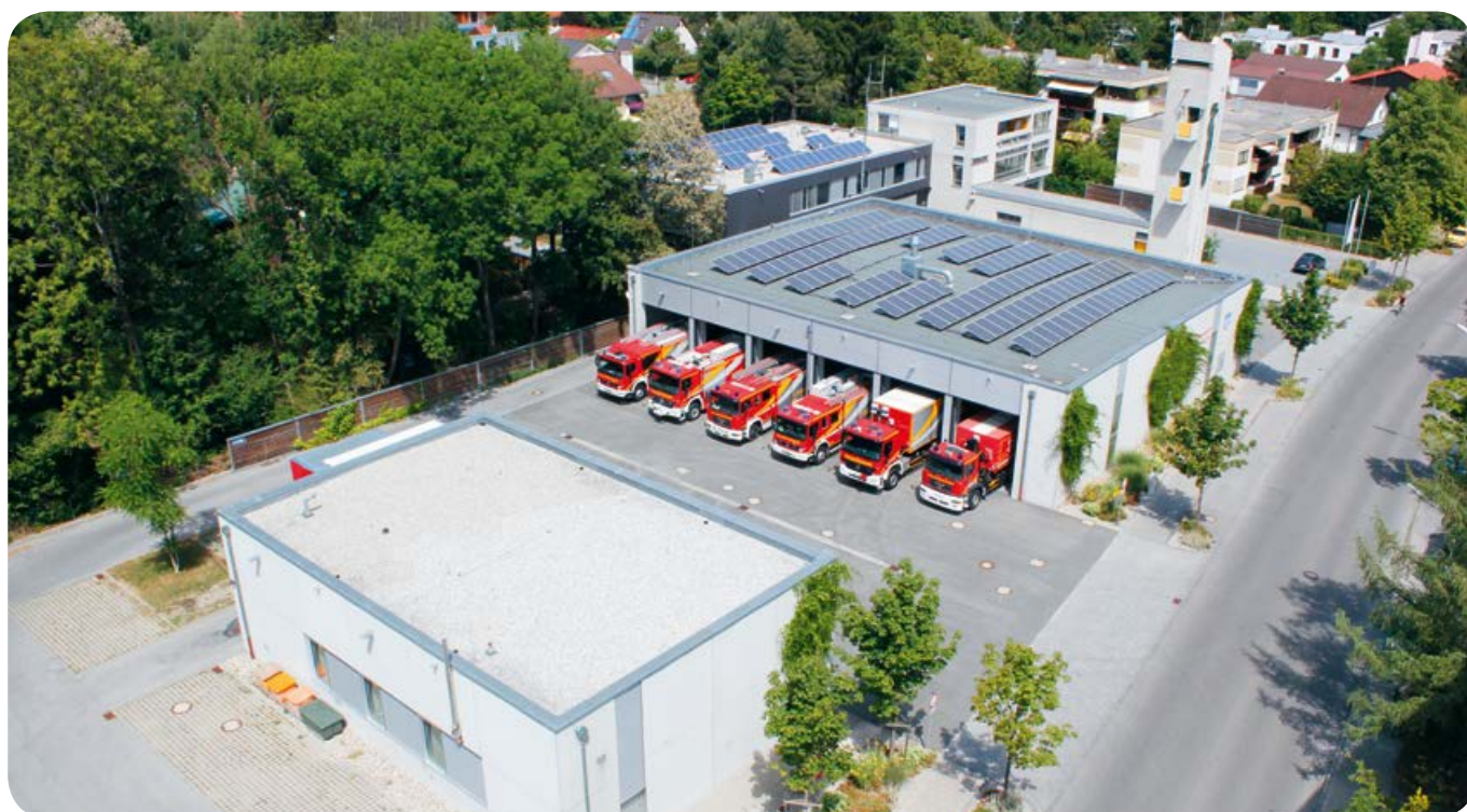
Auf den Dächern des Verwaltungs- und Werkstättentrakts (schwarzer Baukörper) und der Containerhalle (links) könnten nach Vorschlag der Feuerwehr Stockwerke mit Wohnungen aufgesetzt werden.