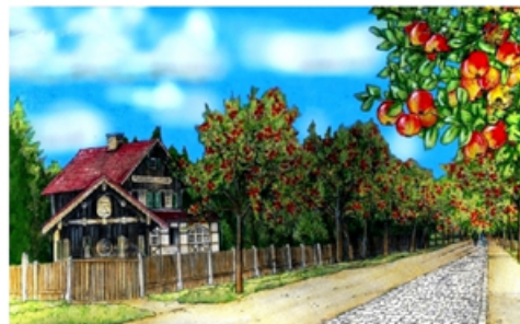
Rosenheimer Landstraße 1955.

Wußten sie, dass die Gemeinde die Apfelbäume tageweise verpachtete. Die Bürger konnten für 1,- DM die Äpfel ernten. Mehr dazu im Film.