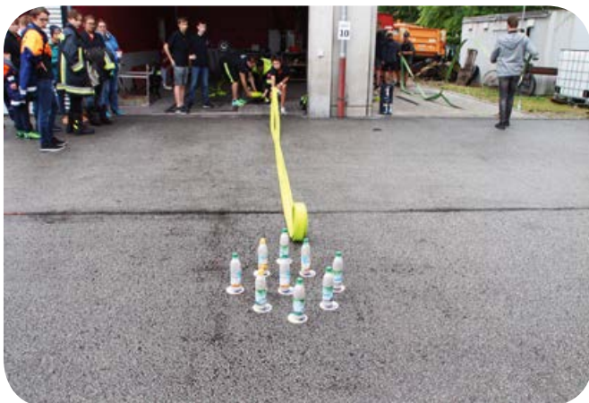
Schläuche auszuwerfen lernt man in der Jugendfeuerwehr. Aber zielen muss man auch können, um die Kegel zu treffen.