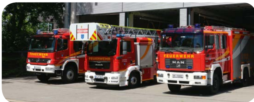
Der Löschzug aus zwei Löschfahrzeugen und der Drehleiter rückt aus zum Einsatz.

tretenen Kameraden oder der Übernahme ausgebildeter Anwärter aus der Jugendfeuerwehr. Es sind lediglich 3 Aktive weniger als im Jahr zuvor.