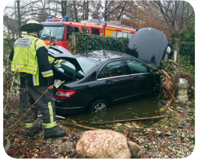
In einem Gartenteich an der Ottostraße landete am 25.11.2018 ein Pkw. Die Fahrerin konnte sich selber retten.