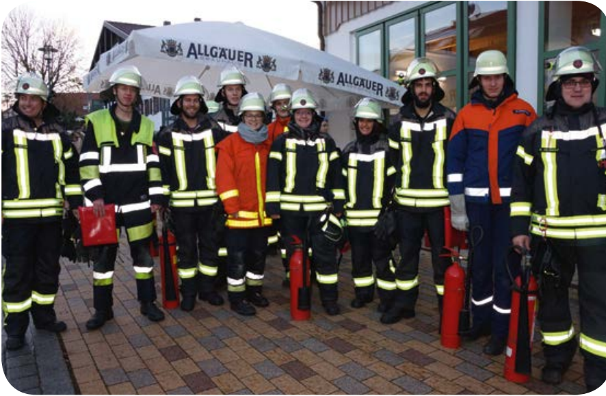
Einteilung der Börwanger und Ottobrunner Einsatzkräfte für die Sicherungsposten mit Feuerlöscher und Löschdecken.

1700 Einwohner zählt der Ort Börwang, der in der Oberallgäuer Gemeinde Haldenwang direkt am Stadtrand von Kempten liegt. Seit 1981 sind die Börwanger und die Ottobrunner Feuerwehr befreundet. Anlass war der damalige Kauf eines in Ottobrunn ausgemusterten Feuerwehrfahrzeuges. Wenn alle vier Jahre 20.000 Besucher nach Börwang strömen, um den Schauer und die Faszination des Umzugs der Klausen, Bärbele, Krampusse und Perchten zu erleben, steht die Börwanger Feuerwehr vor einer sehr großen