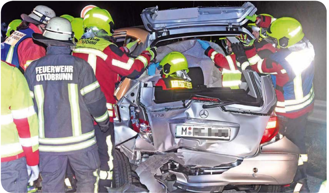
Einsatzkräfte aus Unterhaching und Ottobrunn schnitten am 09.01.2018 zur Personenrettung das Dach des Mercedes ab.

Bei 46 Prozent oder 349 der Einsätze handelte es sich um Alarmer der First Responder. Bei lebensbedrohlichen Erkrankungen oder schweren Verletzungen entscheidet oft eine schnelle medizinische Hilfe über Leben und Tod. Unverzögliches Reagieren im Notfall, Ortskenntnis und kurze Fahrtstrecken machen die First Responder so wertvoll. Innerhalb weniger Minuten erreichen sie den Einsatzort. Unbeeindruckt von der hohen Einsatzbelastung tragen sich immer zwei Kameraden im Dienstplan ein, damit beide Fahrzeuge rund um die Uhr besetzt sind. Manche Schichten bleiben ruhig, in anderen häufen sich die Einsätze. Jeweils fünfmal waren die ehrenamtlichen Helfer am Mittwoch 13.06.2018 und am Sonntag 24.06.2018 gefragt.