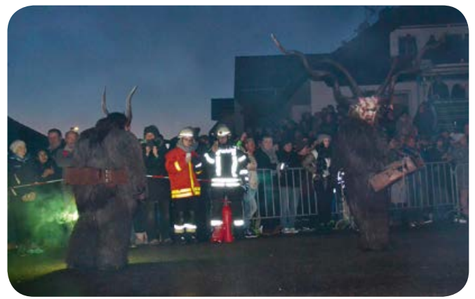
Eine Ottobrunnerin und eine Börwangerin beobachten das Treiben der Perchten, Krampusse und Klausen und achten auf Brandgefahren.