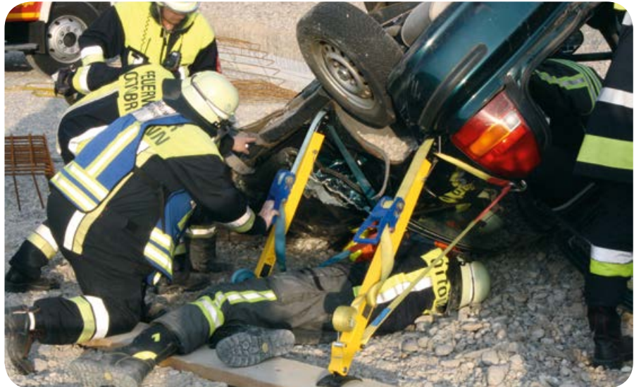
Bei einer Einsatzübung mussten die Kameraden die Verletzten aus einem auf dem Dach liegenden Pkw befreien.

Hinzu kommen viele fachspezifische Übungen zur Vertiefung der Themen, je nachdem welche Tätigkeiten man ausübt. Zehn für Führerscheininhaber Klasse B, 13 für Maschinisten mit dem Führerschein für Lastwagen Klasse C/CE, vier Atemschutzübungen, vier First Responder-Schulungen, zehn Abende für die Grundausbildung (Modulare Truppausbildung) sowie zehn Ausbildungen und Besprechungen der Dienstgrade. Zudem gab es eine Übungswoche zum Ablegen der Leistungsabzeichen. In der Regel finden die Ausbildungen wochentags am Abend