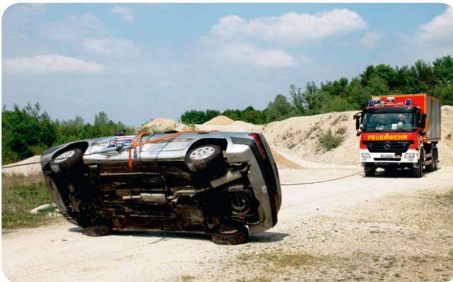
Den Einsatz der Seilwinden übten die Maschinisten indem sie einen umgestürzten Pkw aufstellten.

ab 19.00 Uhr statt. Für spezielle Themen nimmt man sich auch mal einen ganzen Samstag Zeit. Zusätzlich wird jeden Freitagabend für alle Mitglieder Dienstsport angeboten. Für die Jugendfeuerwehr gibt es einen eigenen Dienstplan. Sie trafen sich zu 28 Jugendübungen und fünf Ganztageesschulungen. Viele Kameraden engagieren sich in der Ausbildung und stecken ehrenamtlich viel Zeit in deren Vorbereitungen und Durchführung.