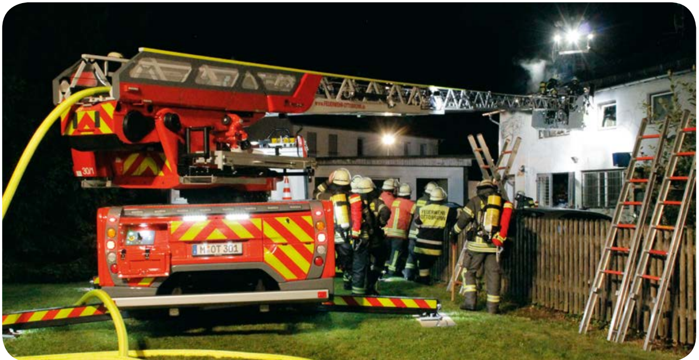
Bei einem Wohnungsbrand in Höhenkirchen kam am 14.07.2018 die Ottobrunner Drehleiter aus einem Nachbargrundstück zum Einsatz.

den. Am 14.07.2018 benötigten die Feuerwehren in Höhenkirchen-Siegersbrunn Unterstützung bei einem Wohnungsbrand mit einer weiteren Drehleiter. Die Befürchtung, dass sich noch Personen in der brennenden Wohnung aufhalten, bewahrheitete sich zum Glück nicht. Jedoch fanden die Einsatzkräfte einen größeren Hund, der an einer Rauchvergiftung erstickt war.