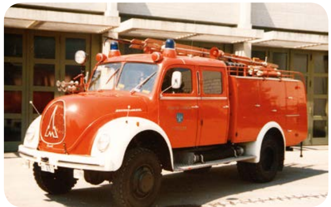
1979: Weiße Kotflügel für bessere Auffälligkeit im Straßenverkehr erhielt das TLF 16 zur Mitte der 1970er Jahre.