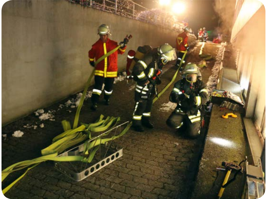
Die Einsatzkräfte trainieren die Abläufe bei der Brandbekämpfung in einem Gewerbegebäude.

Die Zielgruppen der drei Staatlichen Feuerwehrsulen in Geretsried, Regensburg und Würzburg sind der Führungsnachwuchs, die Führungskräfte, Ausbilder und Spezialisten. 103 verschiedene Themen zählt der Lehrgangskatalog auf. Gruppen- und Zugführer, Jugendausbilder oder Gerätewarte lernen dort in ein- bis zweiwöchigen Kursen ihre Aufgaben kennen.