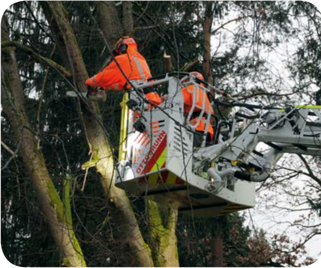
Am 04.01.2018 beseitigte die Feuerwehr in einem Sturm von der Drehleiter aus starke Äste, die auf einen Weg zu fallen drohten.

kümmerten sich um die Fahrerin, die selber aussteigen konnte. Die Ottobrunner Feuerwehr stellte mit Feuerlöschern den Brandschutz sicher und klemmte am Unfallfahrzeug die Batterien ab. Zum Glück waren keine Treibstoffe und Öle ausgelaufen, die das Wasser im Teich verunreinigt hätten.