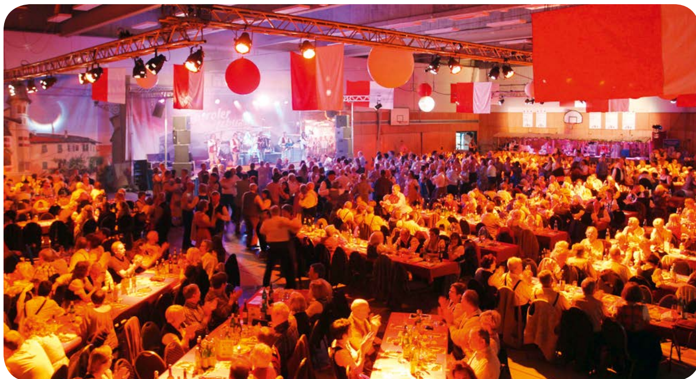
Kulinarische Spezialitäten und Weine aus Südtirol, Tanzvergnügen und Musik bietet die Ottobrunner Feuerwehr auf dem Südtiroler Weinfest.

Mehr als 20 Jahre lang haben Sie an dieser Stelle die Ankündigung des Südtiroler Weinfests für April gelesen. In diesem Jahr veranstaltet die Feuerwehr das Fest erst im Spätherbst am 16. November 2019. Der Grund sind die seit Mai 2018 laufenden Bauarbeiten an der Ferdinand-Leiss-Halle. Mit ihrer Inbetriebnahme wird nach den Sommerferien gerechnet. Die Gemeinde errichtete die Mehrzweckhalle 1977 als Dreifachturnhalle und als Versammlungsstätte. Auslöser für die Sanierung waren statische, konstruktive und brandschutztechnische Mängel an der Hallendecke. Weitere Arbeiten umfassen Maßnahmen an der Akustik, der Heizungs-, und Lüftungsanlage, dem Trink- und Abwasser-Netz, der Gebäudehülle und der Hallenausstattung.