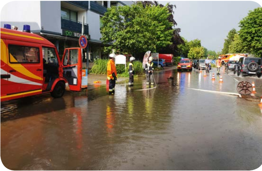
Nach einem starken Gewitterregen war am 09.06.2018 ein Teil der Putzbrunner Straße überschwemmt.

Finden im Wolf-Ferrari-Haus Veranstaltungen auf der Bühne statt, sind zwei Kameraden zum Brandsicherheitswachdienst eingeteilt. Bei Aufführungen sitzen sie seitlich auf der Bühne. Bei Veranstal-