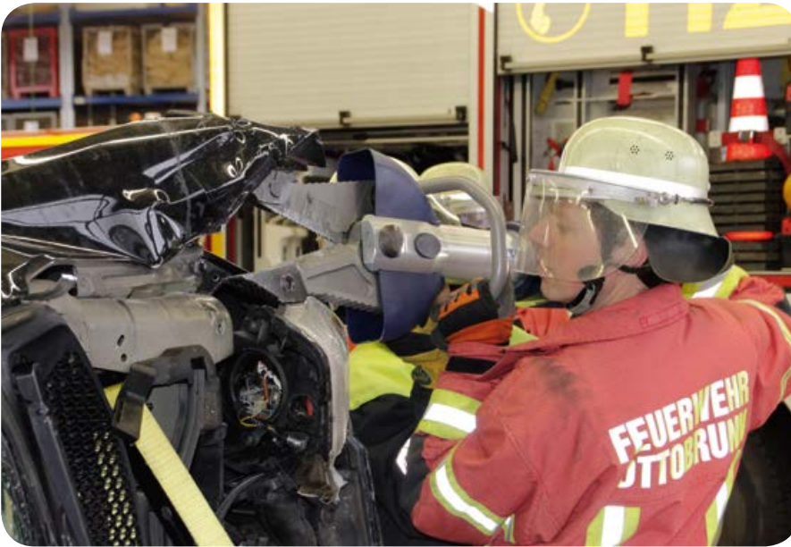
Die Führungskräfte beschäftigten sich einen ganzen Samstag mit Rettungstechniken. Mit dem Spreizer wird ein Karosserieteil entfernt.

Viel Zeit verbringen die Einsatzkräfte bei den Übungen und Ausbildungen. Denn wenn Mitmenschen Hilfe brauchen, dann muss man wissen, was wie zu tun ist. Die Geräte sicher zu bedienen und zu wissen, wie man sie einsetzt, ist genauso wichtig wie das Training der Abläufe bei einem Einsatz. Jeder muss im Team die verschiedenen Aufgaben kennen. Der Übungsplan weist daher viele Termine auf. Fast jeden Monat steht für alle Einsatzkräfte ein gemeinsamer Übungsabend im Kalender. Zehn Hauptübungen waren es letztes Jahr. Lediglich während der Schulferien wird eine Pause eingelegt.