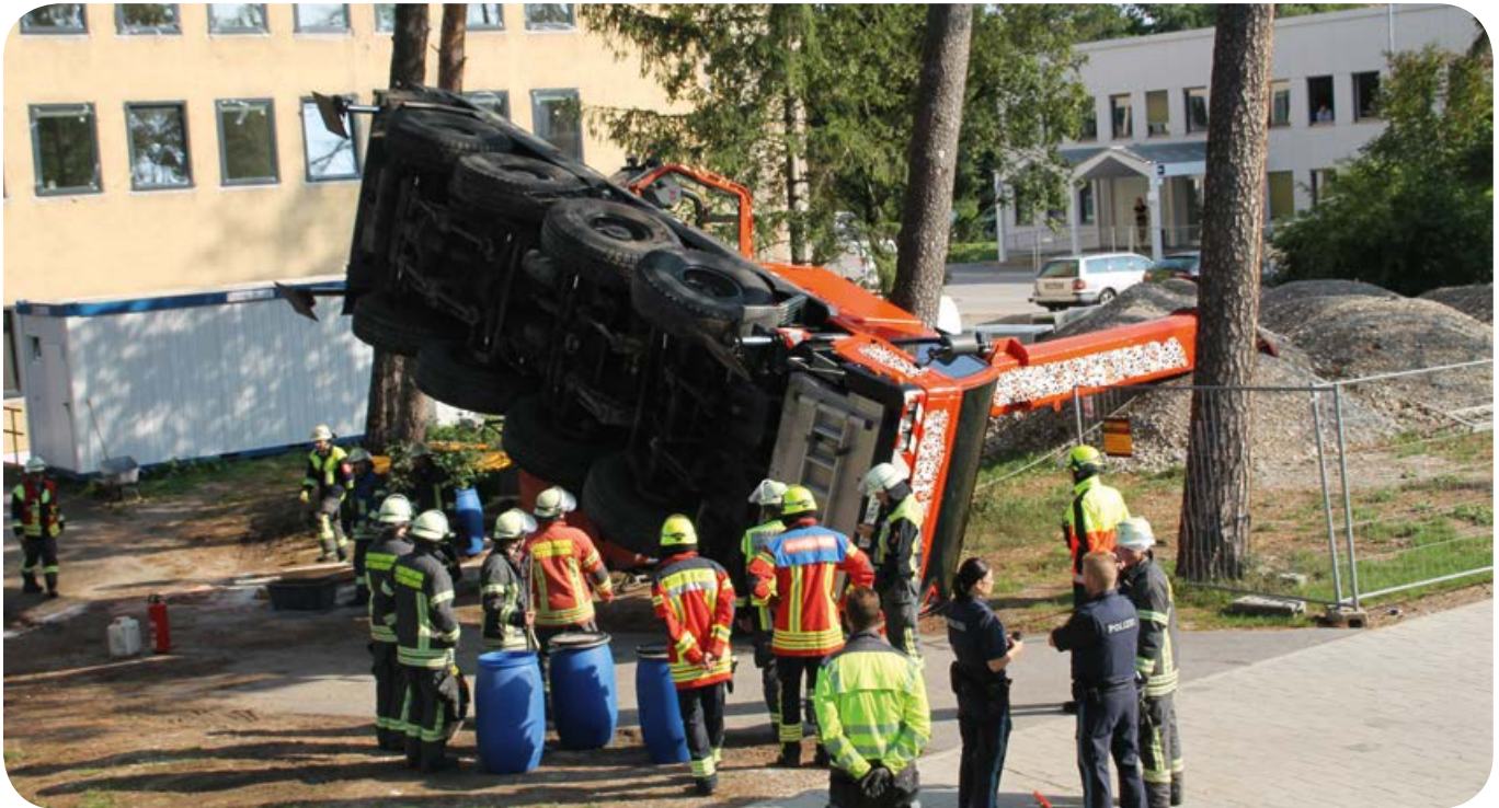
Ein Mobilkran kippte am 05.09.2018 um. Die Feuerwehr fing den auslaufenden Diesel auf und unterstützte bei den Bergemaßnahmen.

Selten im Vergleich zu den Jahren zuvor war die Feuerwehr gefordert, vom Sturm entwurzelte Bäume zu beseitigen oder lose Gebäudeteile zu sichern. Sieben Mal griffen Einsatzkräfte zur Kettensäge, um Bäume zu fällen bevor sie auf die Straße oder gegen Gebäude gekippt und Bürger in Gefahr gebracht oder Schäden verursacht hätten. Dreimal rückte die Drehleiter