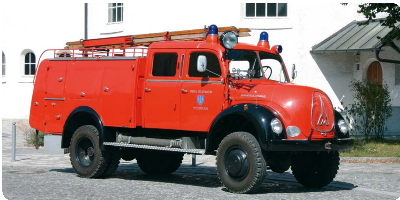
Ein aktuelles Bild, fast im originalen Zustand. Wieder auf schwarze Kotflügel umlackiert, präsentiert sich der Oldtimer in der Form, die er bis Mitte der 1970er Jahre hatte.

Der 16. August 1958 war für die Feuerwehr und die junge Gemeinde Ottobrunn ein historischer Tag. Sie holte ihr erstes, neu beschafftes Einsatzfahrzeug beim Hersteller Magirus in Ulm ab. Zuvor bestand der Fuhrpark der Wehr immer aus gebrauchten erworbenen Fahrzeugen.