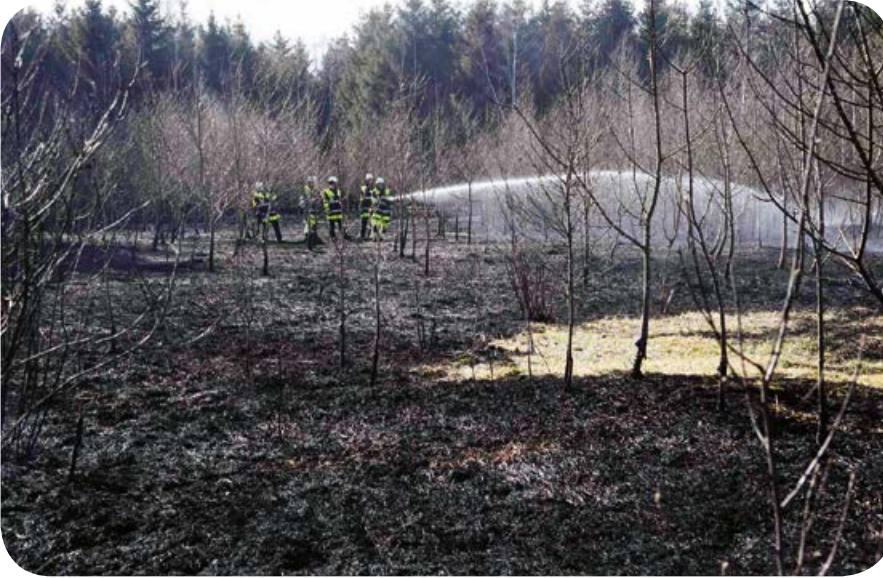
1,5 Hektar trockenes vorjähriges Gras mit einem Jungwald steckte am 04.04.1208 ein Brandstifter bei Waldperlach in Brand.

dreistündigen Einsatzes setzten 33 Kameraden elf Pressluftatmer, vier C-Rohre, vier Wärmebildkameras, 140 Meter B-Schlauch und 135 Meter C-Schlauch, die Drehleiter, einen Lichtmast, einen Hochleistungslüfter, drei Stromerzeuger und drei Kettensägen ein.