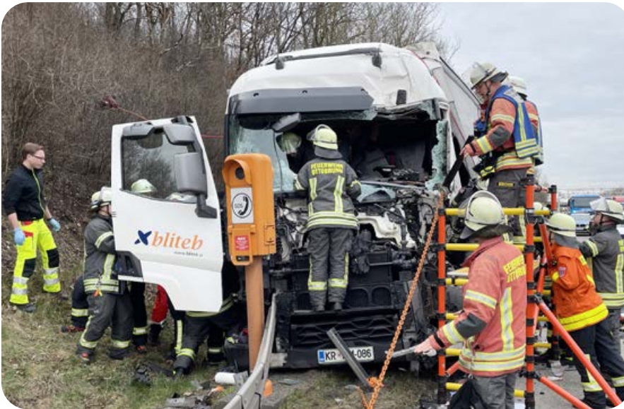
21.3.2023: Nach halbstündiger Arbeit können die Einsatzkräfte den verletzten Fahrer über die Beifahrerseite herausheben.

Zweimal hatte die Ottobrunner Feuerwehr auf der Autobahn schwer eingeklemmte Fahrer aus ihren Lastwagen zu retten. In beiden Fällen war die Ausgangssituation ähnlich. Am 21.3.2023 war ein Sattelzug auf einen anderen Lastzug am Stauende auf der rechten Fahrspur aufgefahren. Dabei gab es einen Aufprall mit etwa 50% Überlappung auf der linken Seite und rechts bohrte sich die Sattelzugmaschine in die Leitplanke. Das Fahrerhaus wurde dabei stark deformiert, der Fahrer war hinter dem Armaturenbrett vor allem im Beinbereich eingeklemmt. Großes Lob von der