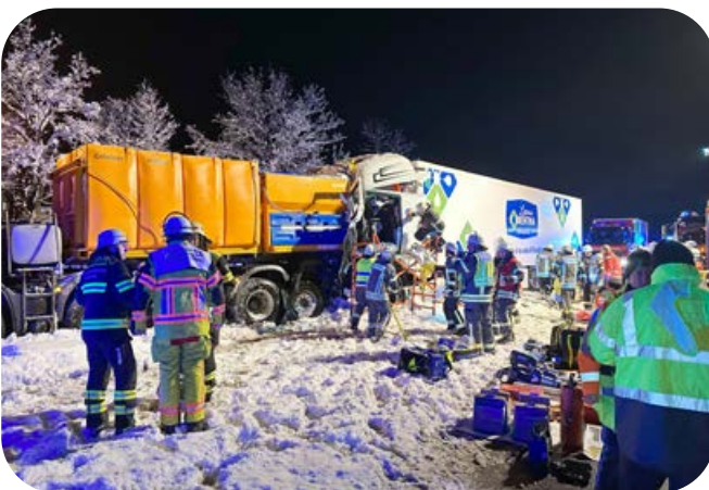
2.12.2023: Der Sattelzug ist auf das bei der Abfahrt Hohenbrunn stehende Fahrzeug der Autobahnmeisterei aufgefahren.

Bei dem Unfall im März kamen die Einsatzkräfte zur medizinischen Versorgung durch die offene Beifahrertüre und die geborstene Windschutzscheibe an den Fahrer. Um ihn aus der Einklemmung zu befreien, war der Plan, die Fahrzeugfront mit dem Armaturenbrett nach vorne zu drücken. Weil für den Spreizzylinder keine geeigneten Ansatzpunkte zu erkennen waren, entschloss man sich, mit der im