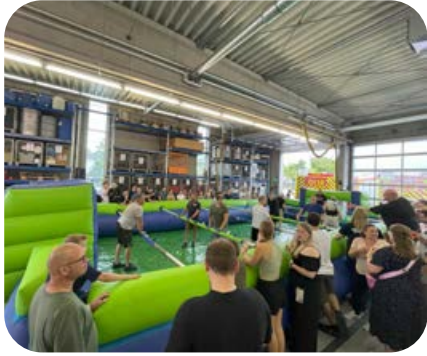
Juli: Mit einem Kameradschaftsfest bedankte sich die Feuerwehr bei ihren Mitgliedern und deren Familien.