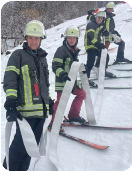
März: Viel Spaß hatten die Kameraden bei der 1. Bayerischen Skimeisterschaft des Landesfeuerwehrverbandes.