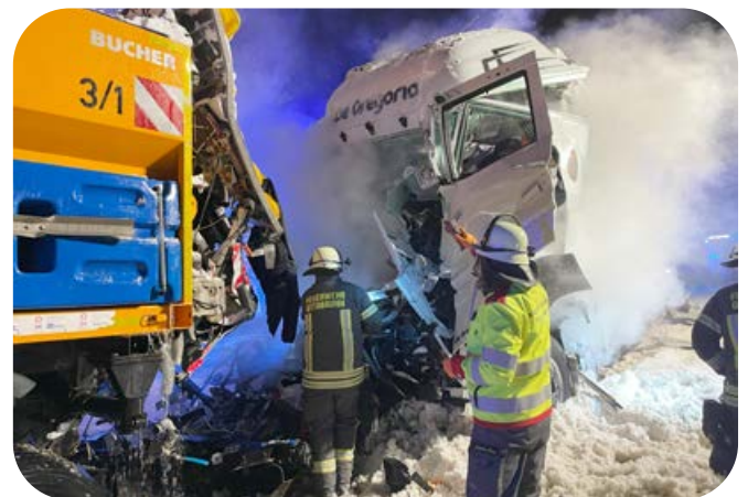
2.12.2023: nachdem die Unfallfahrzeuge getrennt sind, bricht ein Brand aus. Dieser kann sofort mit einem Feuerlöscher bekämpft werden.