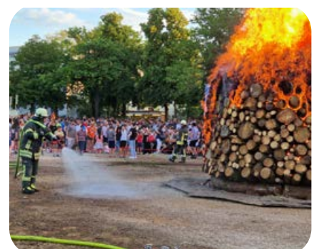
Juli: beim Sommerfeuer des Burschenvereins auf der Festwiese ist die Feuerwehr selbstverständlich auch mit eingebunden.