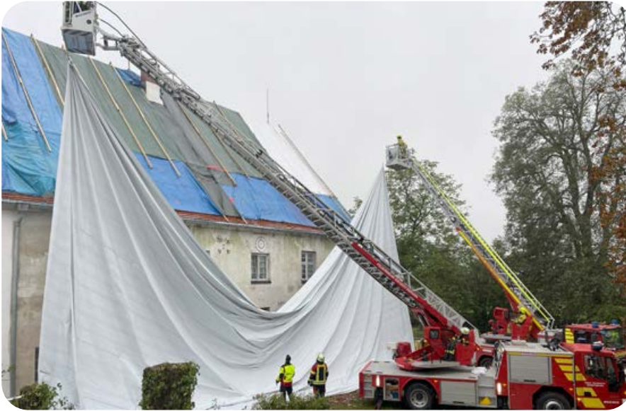
Teamwork der Einsatzkräfte mehrerer Feuerwehren beim Anbringen einer sehr großen Plane über dem Dach eines Gebäudes.

Überall wo man hinblickte: zerstörte Dächer, zerschlagene Fensterscheiben, zersplitterte Rollläden, Löcher von Einschlägen der Hagelkörner in den Fassaden, zerbeulte Autos, Planen über den Dächern, Sperrholzplatten vor den Fensteröffnungen, Abdeckungen über zerborstenen Autoscheiben – furchtbare und nicht vorstellbare Zerstörung ringsherum. Mit diesem Eindruck kamen 13 Ottobrunner Einsatzkräfte nach einem arbeitsreichen Tag aus dem Landkreis Bad Tölz-