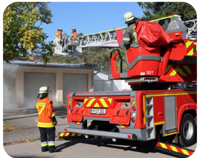
Eine verletzte Person liegt auf dem Dach. Sie muss zügig mit der Drehleiter gerettet werden.