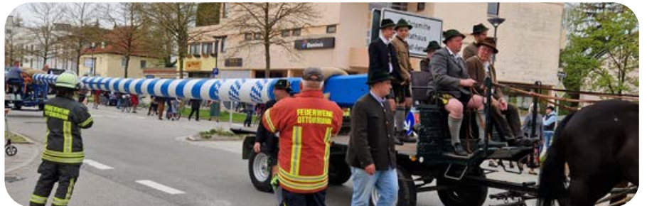
Mai: Den Transport des Maibaums vom Vereinsheim der Burschen zum Festplatz sicherte die Feuerwehr ab. Zuvor übernahm sie noch eine Maibaumwache.