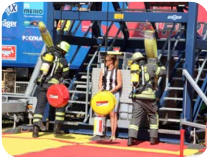
Start! Ein 19 kg schweres Schlauchpaket muss am Fuß der 60 Treppenstufen über die Schulter gelegt werden.

Dänemark, Deutschland, Polen und die Schweiz. Nach den herausfordernden Einzelwettkämpfen standen Staffelläufe auf dem Programm. Hierbei teilte sich ein Team die genannten Aufgaben auf. Eine Atemschutzmaske wird dabei nicht angelegt. Der zweite Platz bei drei Frauengruppen war der Lohn für die monatelangen Vorbereitungen. Die vier Kameraden, die am Vormittag schon die Grenzen ihrer physischen und mentalen Leistungsfähigkeit ausgelotet hatten, traten wieder an. Sie beendeten den Staffellauf in 1:47.97 Minuten. Das brachte sie im Regiocup an die 2. Stelle auf das Siegerpodest. Bei neun angetretenen Männer-Mannschaften reichte es für den 5. Platz.