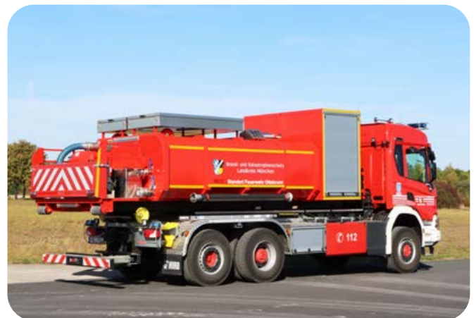
Der Abrollbehälter Tank fasst 10.000 Liter Wasser. Die mit dem Tank verbundene Tragkraftspritze hat eine Leistung von 1500 l/min bei 10 bar.