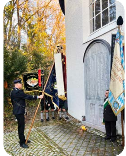
November: Mehrere Ottobrunner Vereine nahmen an der Friedenfeier am Volkstrauertag teil.