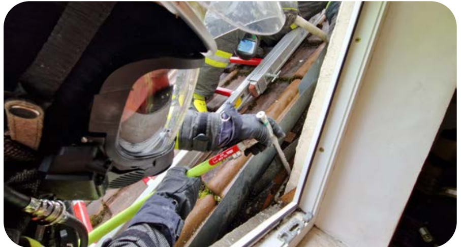
21.5.2023: Mit in den Schlitz zwischen den Wänden eingeschlagenen Löschsonden gelang es den Einsatzkräften, den Brand zu löschen.

Am Abend des 22.6.2023 zog ein Gewitter über Ottobrunn. Um 21.03 Uhr ging der Notruf zu einem Dachstuhlbrand im Ranhazweg ein. Ein Blitz war in einen Baum eingeschlagen und von dort auf den