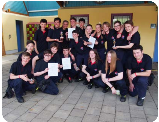
Die 19 Ottobrunner Mädchen und Jungen kamen vom Ausflug nach Friedrichsdorf mit Urkunden nach Hause zurück.