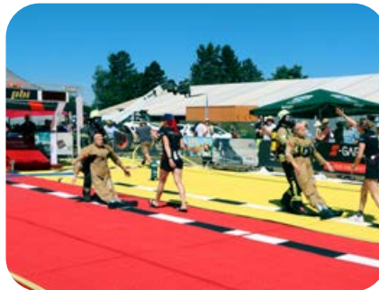
Der Dummy wiegt 80 kg und soll schnellstens 30 Meter rückwärts laufend ins Ziel gebracht werden.