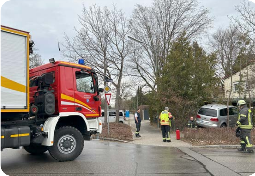
19.3.2023: Mit der Winde des Wechselladerfahrzeuges zog die Feuerwehr einen Pkw aus einem Garten heraus.

Unachtsamkeit, Fehlbedienung, plötzliche Erkrankung – Verkehrsunfälle haben verschiedene Ursachen. Die Klärung, was warum und wie passiert ist, ist Aufgabe der Polizei. Die Feuerwehr versorgt die Verletzten und befreit diese aus ihren Fahrzeugwracks. Die Einsatzkräfte nehmen ausgelaufenen Kraftstoff und Öl auf, stellen den Brandschutz sicher, sichern und räumen die Unfallstelle. Bei allen nachfolgend vorgestellten Einsätzen lautete die Alarmmeldung „Verkehrsunfall – Person