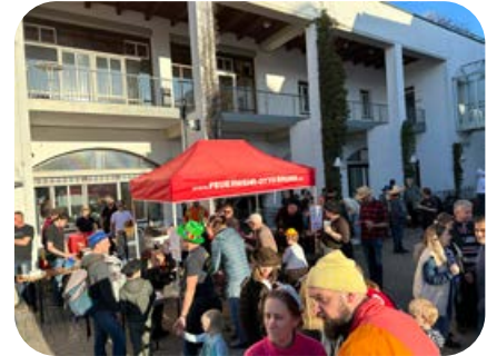
Februar: Beim Kinderfasching auf dem Rathausplatz verköstigte die Feuerwehr die Besucher.