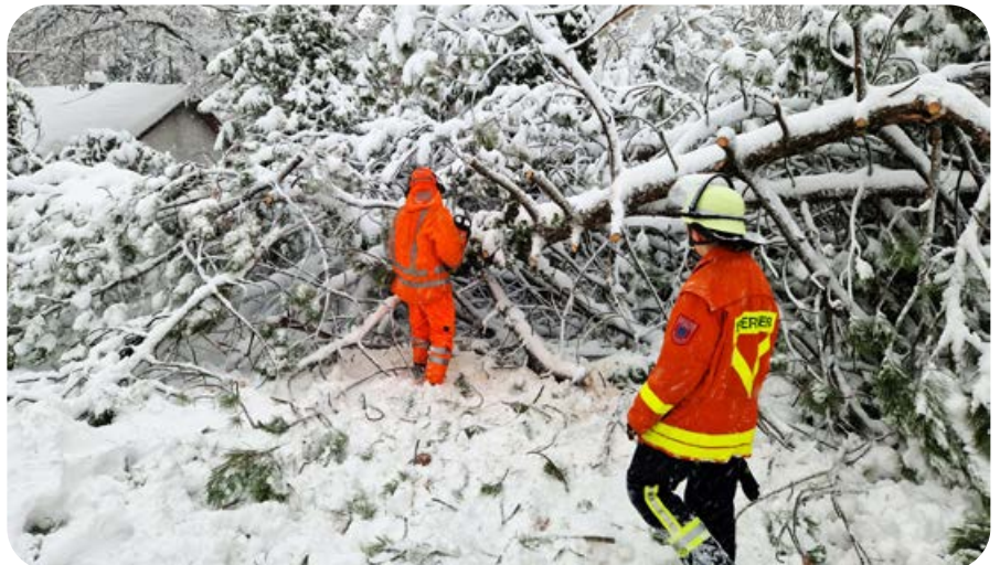
2.12.2023: Der unter der Schneelast zusammengebrochene Baum hat ein geparktes Auto unter sich begraben.