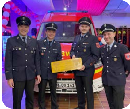
Oktober: Gratulation bei der Nachbarfeuerwehr Unterhaching zur Segnung von Fahrzeugen.