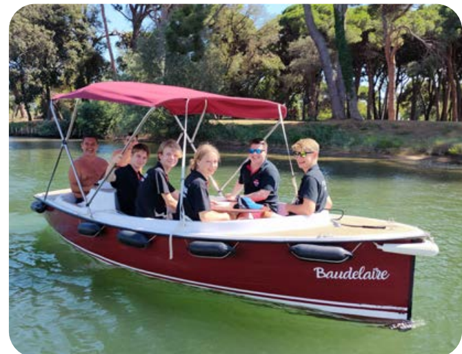
Vom Boot aus erkundete man bei einer Fahrt auf dem Flüsschen Siagne die Partnergemeinde Mandelieu-La Napoule.