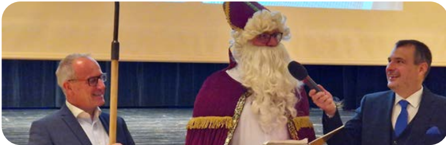
Dezember: Zum Jahresausklang besuchte der Nikolaus die Feuerwehr auf ihrer Weihnachtsfeier.