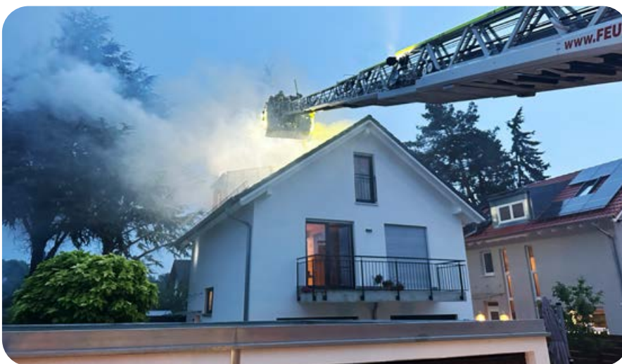
22.6.2023: Nach einem Blitzeinschlag brannte es im Dach eines Wohnhauses. Über die Drehleiter konnte das Feuer gelöscht werden.

Bis nach Unterföhring fuhr am 28.10.2023 die Ottobrunner Feuerwehr. Das liegt am Rüstsatz Bahn, der bei ihr als „Spezi-