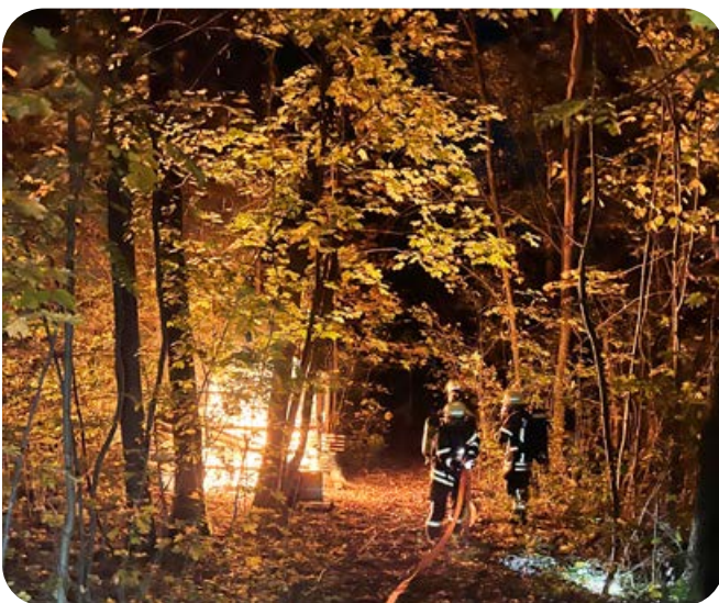
29.10.2023: Bei Ankunft der Feuerwehr stand ein Geräteschuppen der Pfadfinder in Brand.

Wohnung durch die beiden vor der Haustüre aufgestellten Hochleistungslüfter. Der Rettungsdienst versorgte die Verletzte, die eine schwere Rauchvergiftung erlitten hatte und forderte einen nachflugtauglichen Rettungshubschrauber an. Für dessen Landung leuchtete die Ottobrunner Feuerwehr mit zwei Löschfahrzeugen die nahe gelegene Festwiese aus. Jedoch waren die Anstrengungen vergebens, die Frau erlag im Krankenhaus ihren Verletzungen.