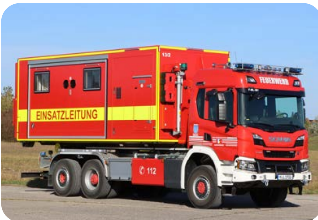
Bei dem Abrollbehälter Einsatzleitung erweitern Ausschübe auf beiden Seiten den Besprechungsbereich von 2,55 auf 6,10 Meter Breite.

2021 hat der Landkreis bei der Firma Jerg einen Abrollbehälter Einsatzleitung bauen lassen. Dieser kommt ergänzend zum großen Einsatzleitwagen des Landkreises, der bei der Feuerwehr Haar stationiert ist, zum Einsatz. Er dient vorrangig der Unterbringung einer Einsatzleitung bzw. eines Stabes bei Einsätzen nach Art. 15 oder Art 6. BayKSG. Im vorderen Teil befindet sich ein Funkarbeitsplatz. Davon abgeteilt ist der große Besprechungsraum. Beim Transport ist der Container 2,55 Meter breit. Dank beidseitiger Ausschübe ergibt sich ein 6,10 Meter breiter Innenraum. Dann können Tische für 16 Arbeitsplätze aufgestellt werden. Die Wände sind als magnetische Whiteboards nutzbar, an einer Wand hängt ein großes interaktives Display mit integriertem PC.