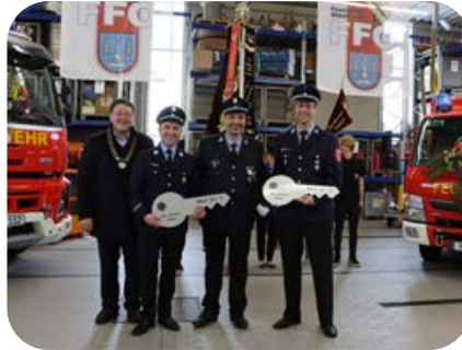
Januar: Zwei neue Fahrzeuge erhielten im Rahmen eines ökumenischen Gottesdienstes ihren kirchlichen Segen.

Retten, Löschen, Bergen, Schützen – unter diesem Motto stehen die Aufgaben der Feuerwehr. Aber neben den Einsätzen fanden sich 2023 im Kalender der Ottobrunner Feuerwehr noch viele Termine, bei denen sie sich präsentierte und am Gemeindeleben teilnahm. Ein Streifzug in Bildern.