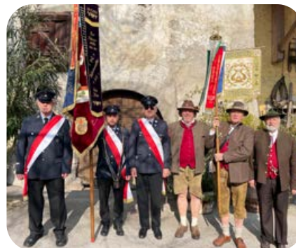
März: Der Sängerkreis und die Feuerwehr führen zum Gertraudfest in die Südtiroler Partnergemeinde Margreid.