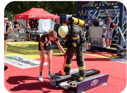
Mit Hammerschlägen wird das 75 kg Gewicht nach hinten getrieben. Eine Schiedsrichterin passt dabei genau auf.