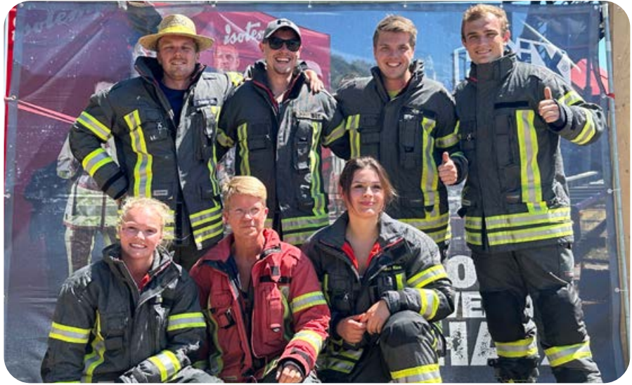
Erschöpft aber glücklich: Drei Ottobrunner Kameradinnen und vier Kameraden traten bei der FireFit Challenge an.

An dieses Ergebnis von Hochleistungs-Sportlern kamen die beiden Frauen und die vier Männer der Ottobrunner Feuerwehr nicht ganz ran. Dennoch gelang es dem besten Ottobrunner in 2 Minuten