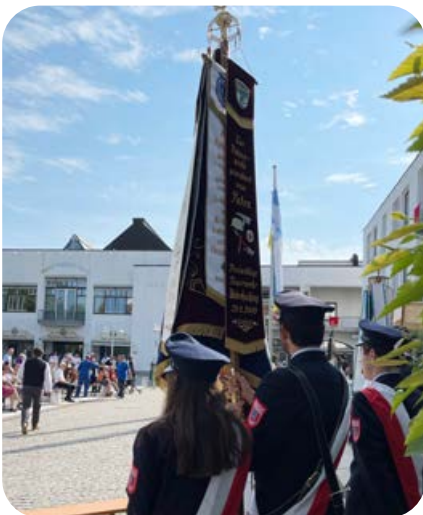
Juni: Auch an der Fronleichnamsprozession nahm die Feuerwehr mit ihrer Fahne teil und sicherte den Prozessionsweg ab.