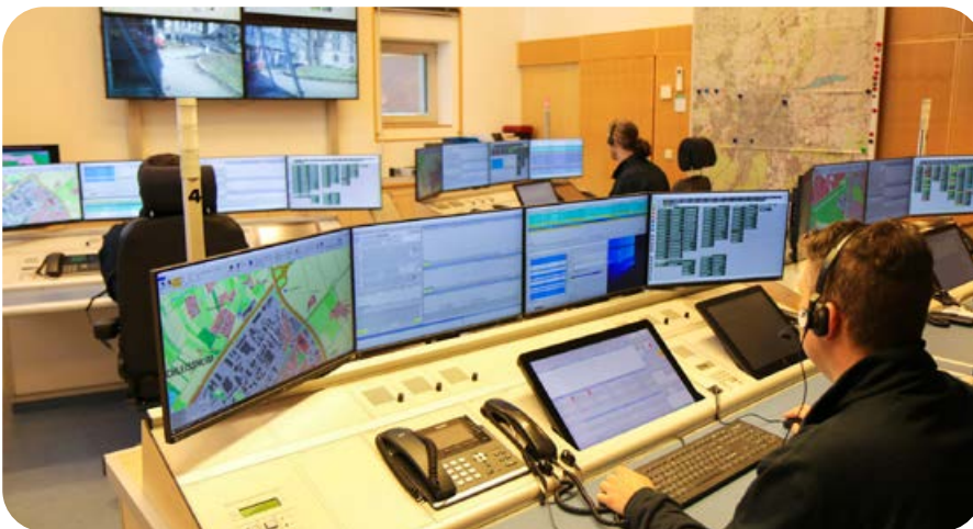
Herzstück: Von der Feuerwehreinsatzzentrale „Florian München-Land“ im Landratsamt werden die Einsätze der 45 Freiwilligen Feuerwehren sowie der meisten der 11 Betriebs- und Werkfeuerwehren im gesamten Landkreis koordiniert.

Am 2.3.1973 ging die Feuerwehreinsatzzentrale im Landratsamt in Betrieb. Seitdem haben die Wehren nicht nur eine gesicherte Alarmierung und eine Übermittlung der Einsatzörtlichkeit, sondern über Funk auch einen zuverlässigen, hilfsbe-