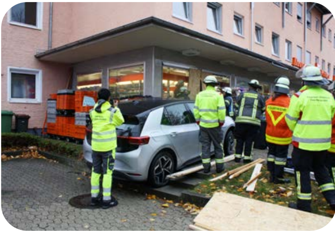
17.11.2023: Ein Pkw war beim Ausparken die Treppenstufen vor einem Drogeriemarkt in der Putzbrunner Straße hochgefahren und gegen das Gebäude gestoßen.

für erhebliche Verkehrsbehinderungen in den angrenzenden Straßen. Bei Eintreffen der First Responder war die Fahrerin noch in ihrem Pkw eingeschlossen. Alle Maßnahmen zur technischen Rettung durch Entfernen der Türen und des Daches wurden vorbereitet, aber die Frau konnte von den Einsatzkräften mittels eines Spineboards schonend aus ihrem Fahrzeug herausgeholt werden. Die anderen beteiligten Fahrer sowie die zehn Fahrgäste im Bus blieben unverletzt.