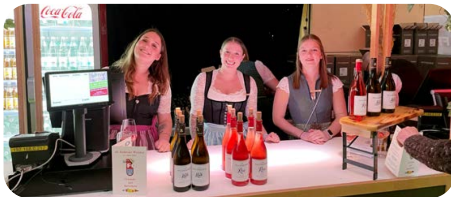
Weißweine, Rotweine und Rosé-Weine stehen zur Wahl. Alle kommen aus unserer Südtiroler Partnergemeinde Margreid.

Wir freuen uns auf Ihren Besuch am 20. April 2024 in der Ferdinand-Leiss-Halle im Sportpark am Haidgraben. Einlass ist ab 18.00 Uhr. Platzreservierungen und Kartenbestellungen unter Telefon 089 / 608 31 45 oder E-Mail karten.weinfest@feuerwehr-ottobrunn.de