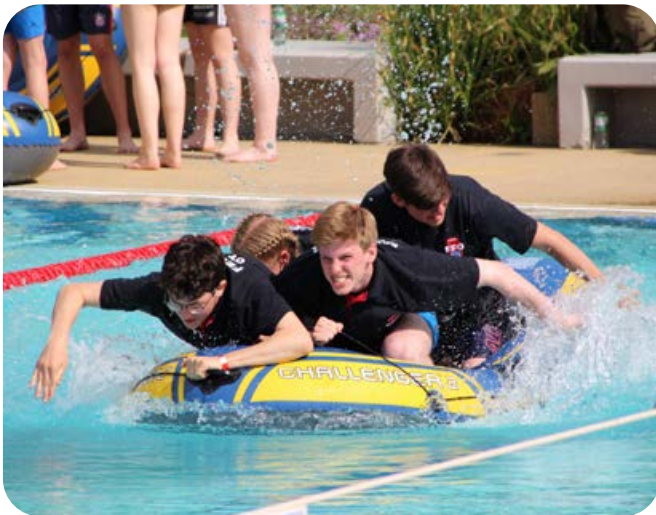
Die meisten Wettkämpfe beim Besuch bei der Jugendfeuerwehr Friedrichsdorf in Hessen spielten sich auf und im Wasser ab.

besuchte man die Löschhubschrauberstation und die Force Opérationnelle Risques Catastrophes Environnement. Diese beschäftigt sich mit Prävention, Erkundung und Intervention zum Schutz der Wälder vor Waldbränden. Ein Tag der Reise stand ganz im Zeichen vom Wassersport mit Baden, Stand-Up-Paddeln und Schnorcheln im warmen Wasser. Bei einem Stadtbummel in Cannes bewunderten die Ottobrunner den roten Teppich der Filmfestspiele und erkundeten die Partnergemeinde Mandelieu La-Napoule.