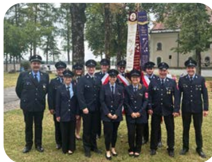
Eine Abordnung aus Ottobrunn gratulierte der Feuerwehr Siegersbrunn zu ihrem 150-jährigen Bestehen.