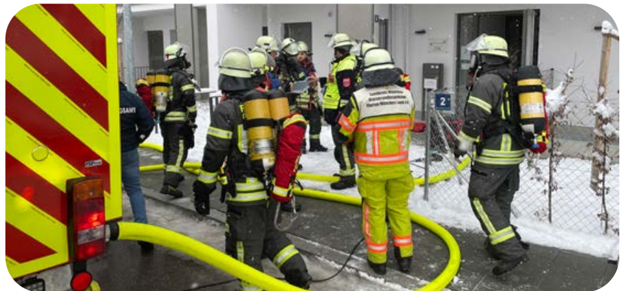
23.1.2023: Mit Atemschutzgeräten suchten 13 der 46 Ottobrunner Einsatzkräfte in der Kindertagesstätte an der Ada-Lovelace-Straße nach der Ursache für die starke Rauchentwicklung.

Bei mehr als der Hälfte der 127 Brandeinsätze, zu denen die Ottobrunner Feuerwehr im Jahr 2023 ausrückte, schlugen Rauchmelder Alarm. Von den 60 automatisch ausgelösten Brandmelderalarmen führten 17 zur Containersiedlung für Asylbewerber auf den Neubiberger Teil des Landschaftsparks. Wegen der großen Anzahl der Bewohner und der hohen Gefährdungseinschätzung stehen die Feuerwehren Neubiberg, Unterbiberg, Ottobrunn und der Universität der Bundeswehr im Alarmplan. Es stellten sich in fast allen Fällen Kochdämpfe als Ursache heraus.