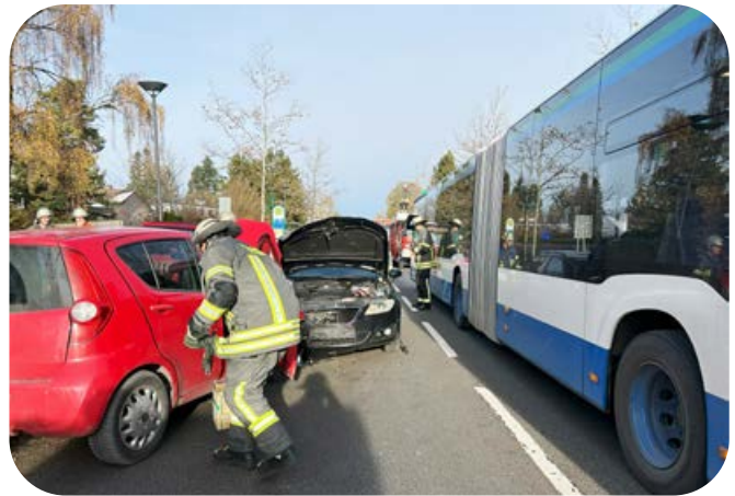
27.11.2023: Nach dem Zusammenstoß von zwei Pkw und einem Linienbus auf der Rosenheimer Landstraße musste eine Fahrerin von der Feuerwehr aus ihrem Auto befreit werden.