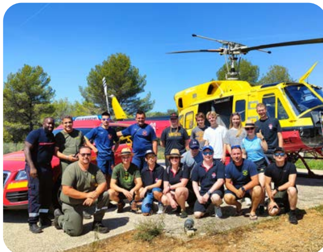
Für die Waldbrandbekämpfung setzt die Feuerwehr des Départements Alpes-Maritimes Löschhubschrauber ein.