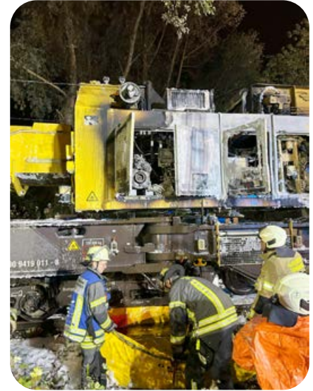
28.10.2023: Alarmiert zu einem brennenden Bauzug bei Unterföhring, war für die Ottobrunner Feuerwehr kein Feuer mehr zu löschen. Sie half beim Auffangen auslaufender Betriebsstoffe.