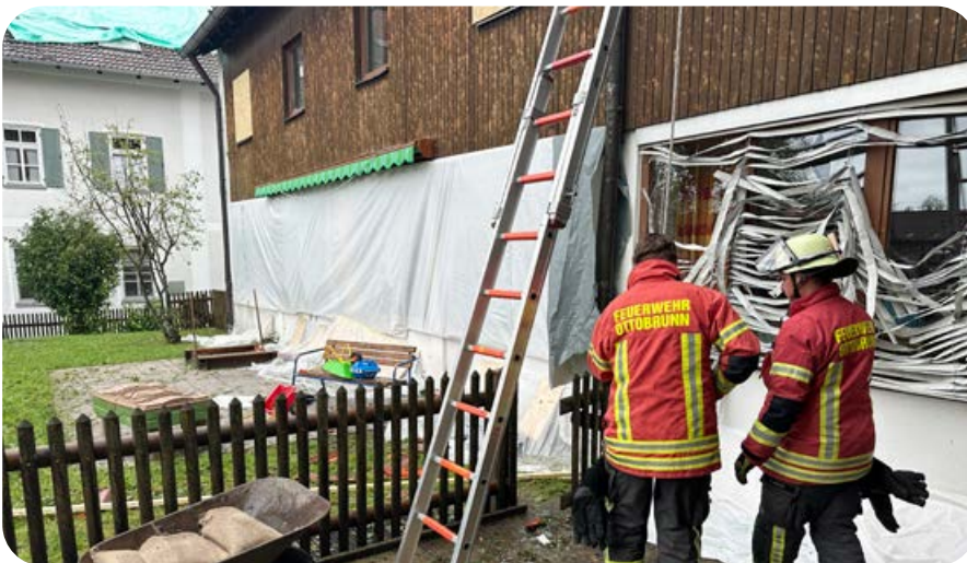
Überall sah man die katastrophalen Zerstörungen durch den Hagelschlag an Fenstern, Rollläden, Fassaden und Dächern.

Wolfratshausen zurück. Am 26.8.2023 hatten tennisballgroße Hagelkörner am Alpenrand mehrere Ortschaften verwüstet. Eine davon war Benediktbeuern mit ihrer bekannten Klosteranlage und Basilika. Über 1000 Häuser – also etwa 80 Prozent der Gebäude – in der Gemeinde mit etwa 4000 Einwohnern wurden in wenigen Minuten schwer beschädigt, hieß es in den Medien. Der nachfolgende Regen drang in die Häuser ein, Mauerwerk und Holzbalken saugten sich mit Wasser voll.