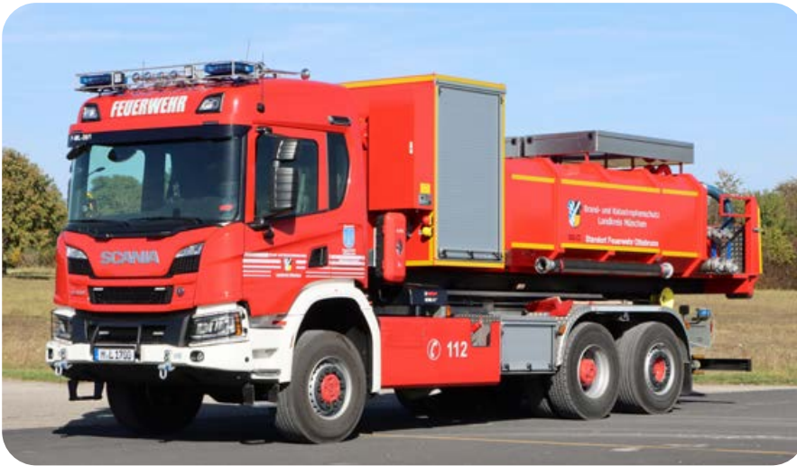
Der Landkreis München stationierte bei der Ottobrunner Feuerwehr ein Wechselladerfahrzeug mit zwei Abrollbehältern.

Seit Oktober steht ein weiteres Einsatzfahrzeug in der Fahrzeughalle der Ottobrunner Feuerwehr. Den Wechsellader und zwei Abrollbehälter hatte der Landkreis München im Rahmen des Brand- und Katastrophenschutzes angeschafft. Im Ergebnis eines Bewerbungsverfahrens erhielt Ottobrunn den Zuschlag für die Stationierung. Auf Anforderung bringt die Wehr das Fahrzeug zu Einsatzstellen im gesamten Landkreis.