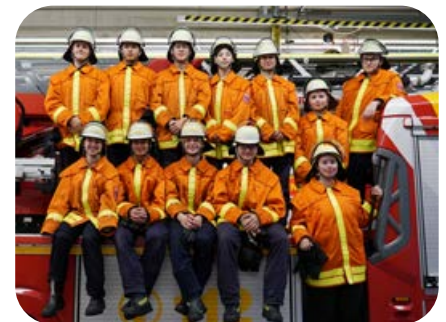
12 Mädchen und Jungen wechselten nach abgeschlossener Ausbildung im Sommer 2023 in den Einsatzdienst.