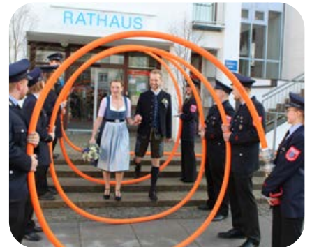
Mai: Wenn ein Feuerwehrmitglied heiratet, gratulieren die Kameraden vor dem Standesamt.