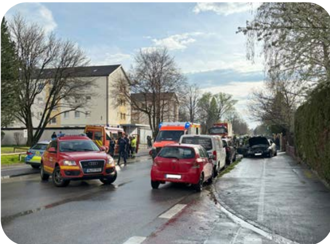
23.4.2023: In Folge eines medizinischen Notfalls geriet ein Pkw-Fahrer in der Putzbrunner Straße auf den Gehweg.

Unübersichtlich sah am 17.5.2023 die Situation auf der Autobahn beim Eintreffen der ersten Einsatzkräfte der Feuerwehr aus: zwei Unfallfahrzeuge standen etwas voneinander entfernt auf der linken Fahrspur, ebenso mehrere unbeschädigte Pkw. Zwei Verletzte lagen auf der Fahrbahn, betreut von Ersthelfern, weitere Personen standen in der Unfallstelle. Die Einsatzkräfte konzentrierten sich auf die Verletztenbetreuung, stellten den Brandschutz sicher, klemmten die Batterien an den Unfallfahrzeugen ab und banden auslaufende Betriebsstoffe mit Ölbindern. Zudem sperren sie für die Rettungsarbeiten und die Landung des Rettungshubschraubers die Autobahn. Wie sich in den Gesprächen mit den Ersthelfern herausstellte, waren es Mitglieder von Freiwilligen Feuerwehren oder von Rettungsdiensten. Sie hatten vor Eintreffen der Feuerwehr die Türen des einen Pkw mit Kraftanstrengung geöffnet und den bewusstlosen Fahrer herausge-