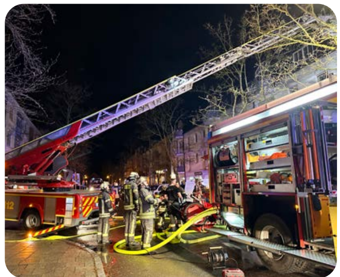
21.12.2023: In der Rathausstraße bekämpfte die Ottobrunner Feuerwehr mit 54 Einsatzkräften einen Zimmerbrand.