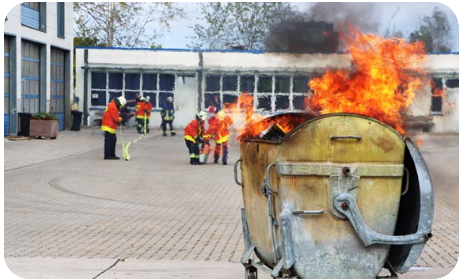
Eine Mülltonne auf dem Bauhofgelände brennt, der Löschangriff wird aufgebaut.

Treffen an dem Samstag war um 6.45 Uhr im Gerätehaus zur Einteilung in zwei Gruppen mit den ihnen zugeordneten Fahrzeugen und die Besetzung der Einsatzzentrale, die den Funkverkehr bei den Übungen abwickelte. Gegen 9.00 Uhr rückte eine Gruppe zu einem Wasserschaden im Technikbereich des Phönix-Bades aus, für die andere Gruppe folgte kurz