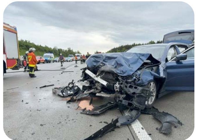
17.5.2023: Auf der A 99 kam es in Höhe der Anschlussstelle Ottobrunn zu einem Zusammenstoß von zwei Pkw.