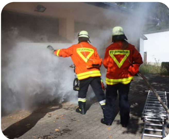
Theaternebel quillt aus der Garage. Dort vermutet der Angriffstrupp den Brandherd geht zum Löschen vor.

Kurz nach dem Mittagessen lautete die Alarmmeldung: Lagerfeuer in einem Waldstück an der Putzbrunner Straße. Einsatz