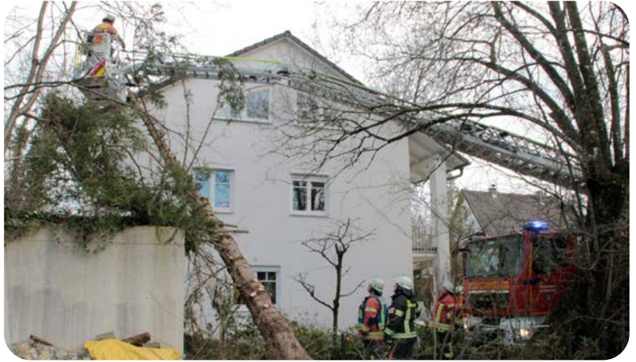
31.3.2023: Die Drehleiter kam zum Einsatz, um den gegen ein Haus gefallenen Baum zu entfernen und, um das Dach auf Beschädigungen zu kontrollieren.

2.12.2023: Schneeschaufeln, Schubkarren und Schneefräsen nutzten die 36 Einsatzkräfte, um Schnee vom Hallenbaddach zu entfernen.