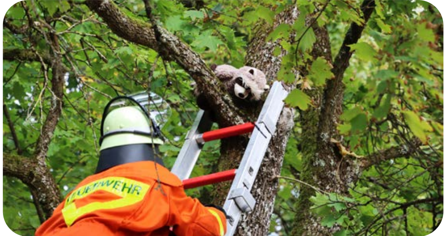
Die Rettung für das Stofftier im Baum naht.

für alle, hieß es am Spätnachmittag, als die Feuermeldeanlage der Grundschule an der Lenbachallee einen Alarm auslöste. Für den Abschluss der Einsatzserie sorgte eine Personensuche im Landschaftspark. Der Aufbau von Beleuchtung des Geländes und der Einsatz der Wärmebildkameras lauteten die Übungsinhalte. Nach viel Herumlaufen zwischen den Baumin-seln und an den früheren Bunkeranlagen waren alle Vermissten gefunden. Gegen 22.00 Uhr fand der lange Übungstag sein Ende. Zu einem Ernstfall musste die Ot-tobrunner Feuerwehr an diesem Tag je-doch nicht ausrücken.