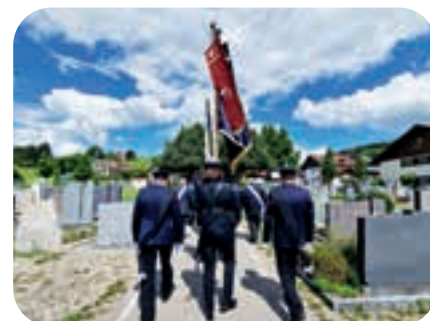
Juni: Auch in der Trauer verbunden mit unserer befreundeten Feuerwehr Börwang bei der Beisetzung ihres Ehrenvorstandes.