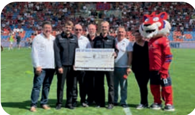
Spendenübergabe der Spielvereinigung Unterhaching an die Feuerwehr Ottobrunn und an die Harzer Sonnenzwerge.

Wer Maurice-Joel unterstützen möchte, kann dieses gerne machen mit einer Spende an IBAN: DE 38 2635 1015 0215 3254 65 bei der Sparkasse Osterode BIC: NOLADE21HZB mit dem Stichwort „Maurice-Joel“. Oder man geht auf die Homepage www.harzer-sonnenzwerge.de .