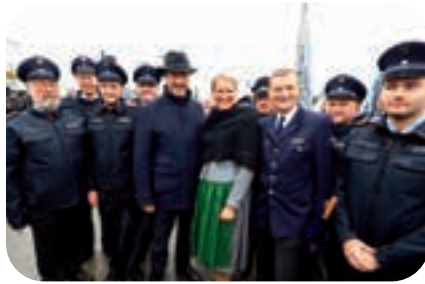
September: Beim Jubiläum der Augsburger Feuerwehr ergab sich spontan ein Foto mit Ministerpräsident Markus Söder.