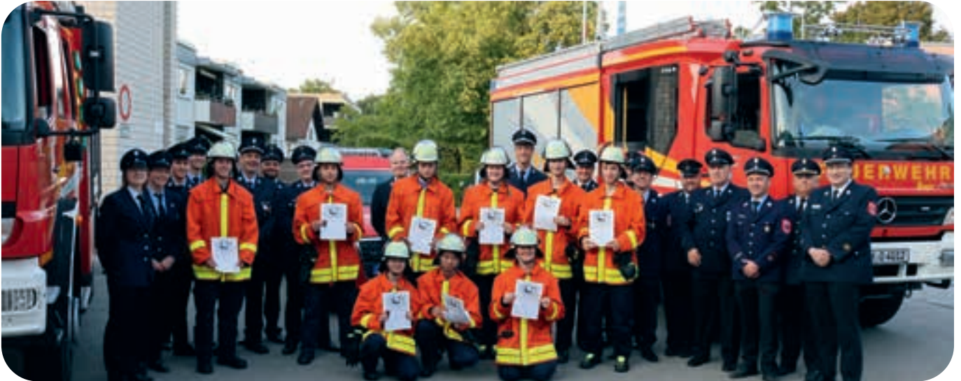
Neun Jugendliche legten am 26.07.2024 ihre Zwischenprüfung der Modularen Truppausbildung erfolgreich ab.