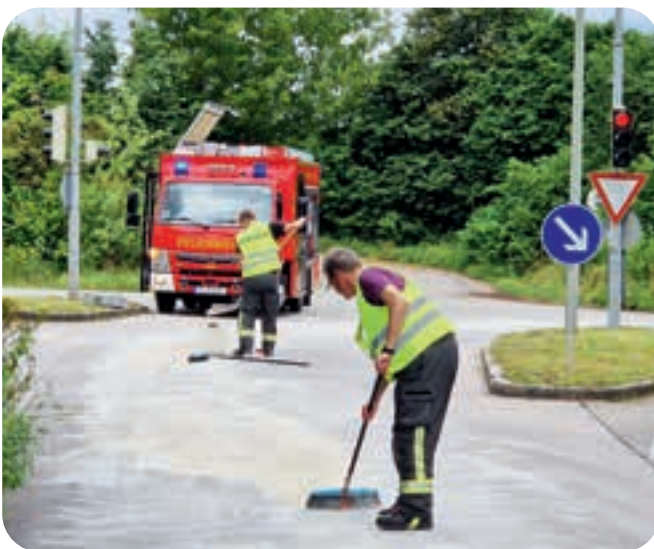
13.07.2024: Mit Ölbindemittel war eine Dieselspur in der Daimlerstraße abzustreuen, einzukehren und aufzunehmen.

Anders sah die Lage am Hachinger Bach, im Würmtal und vielen südbayerischen Landkreisen aus. Ottobrunner Einsatzkräfte waren ab dem 02.06.2024 mehrere Tage lang, fast rund um die Uhr, unterwegs. Zuerst transportierten sie mit dem Wechsellader Sandsäcke von der Sandsackfüllstation im Würmtal zu verschiedenen Einsatzstellen. Dann verlagerte sich der Schwerpunkt der Hilfe in den Landkreis Pfaffenhofen an der Ilm. Eingebunden in Hilfskontingente des Landkreises München schichteten Ottobrunner Sandsackwälle am 02.06.2024 in Hohenwart, in Vohburg an der Donau und am Kraftwerk Irsching auf. So halfen sie mit, dass die steigenden Wassermassen von Bächen und der Donau nicht noch weitere Gebiete, Orte und Infrastruktureinrichtungen überschwemmten.