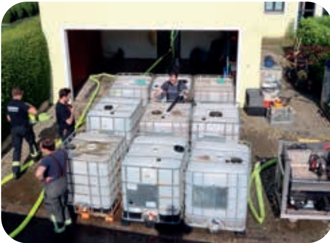
04.06.2024: Das abgesaugte Öl-Wasser-Gemisch lagerten die Feuerwehren in IBC-Containern. Dort setzte sich die Ölschicht ab und konnte zur Entsorgung von Saugwagen abtransportiert werden.

Die Ottobrunner Feuerwehr ist zuständig ab der Anschlussstelle Ottobrunn Richtung Nürnberg bis zur Ausfahrt Hohenbrunn und in Richtung Süden bis zum Südkreuz inklusive seiner Verbindungsrampen zur A8 Richtung Ramersdorf oder Salzburg sowie zur A995 Richtung Giesing.