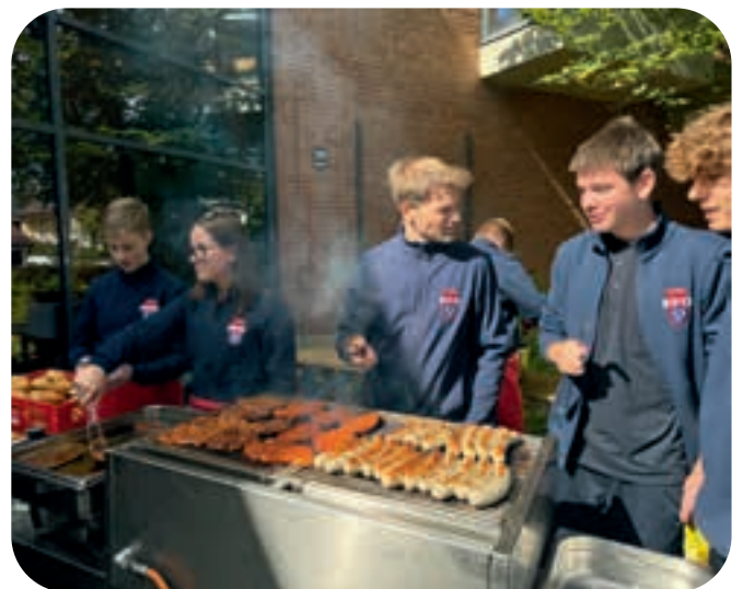
Beim Jubiläum der Michaelskirche grillte die Jugendfeuerwehr mit ihren Ausbildern für die Gottesdienstbesucher.