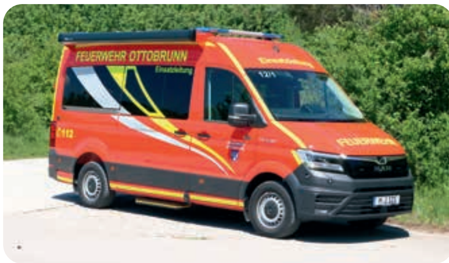
Seit April 2024 neu im Fuhrpark, der Einsatzleitwagen auf MAN TGE.

Vor vier Jahren trafen sich die Führungskräfte zu einem Workshop, um die Beschaffung eines Einsatzleitfahrzeuges zu planen. Seitdem der Vorgänger im Jahr 2002 in Dienst ging, waren die Einwohnerzahl und das Gefahrenpotential in Ottobrunn gestiegen, haben die Einsatzzahlen sowie die Größe der Feuerwehr