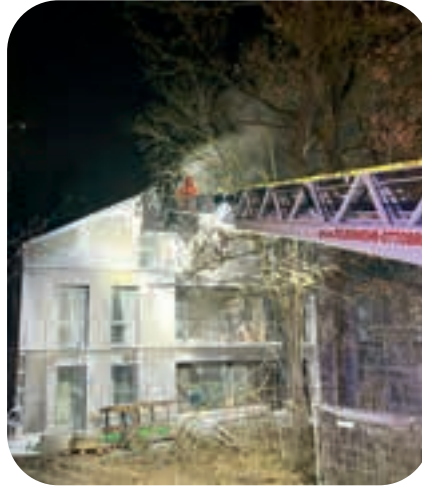
25.01.2024: Zum löschen der hölzernen Fassade in der Luitpoldsiedlung kam die Drehleiter zum Einsatz.

Fahrzeugbrände beschäftigten die Ottobrunner Feuerwehr mehrfach. Am 26.08.2024 rückten 23 Einsatzkräfte für etwa eine Stunde in der Schwalbenstraße aus, weil ein Transporter eines Handwerkes im Motorraum brannte. Am 04.09.2024 um 02.16 Uhr hieß es, dass zwei Fahrzeuge im Technologie- und Innovationspark brennen. Vor Ort zählten die 46 Ottobrunner Einsatzkräfte zwölf lichterloh in Flammen stehende Personen- und Lieferwagen. Wegen der Vielzahl an Brandstellen wurde die Neubiberger Feuerwehr hinzualarmiert. Verletzt wurde