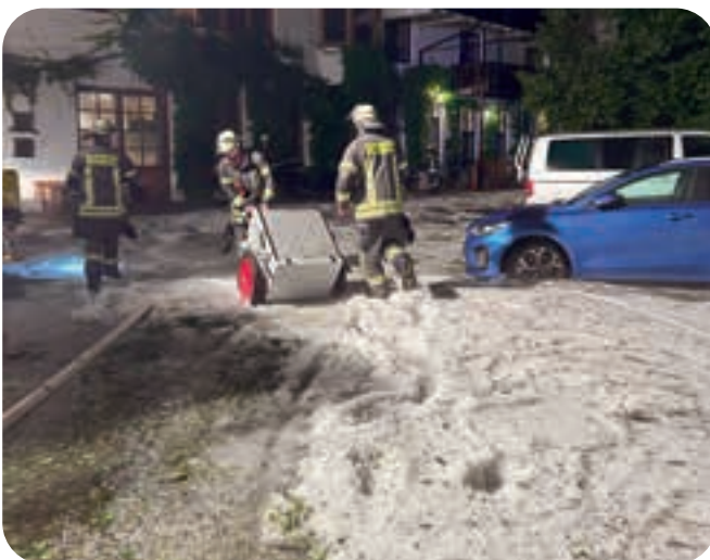
12.07.2024: In Höhenkirchen und Siegersbrunn lag nach einem schweren Gewitter der Hagel hoch auf den Straßen. Die Ottobrunner Feuerwehr beseitigte mehrere, durch den Starkregen verursachte, Wasserschäden.