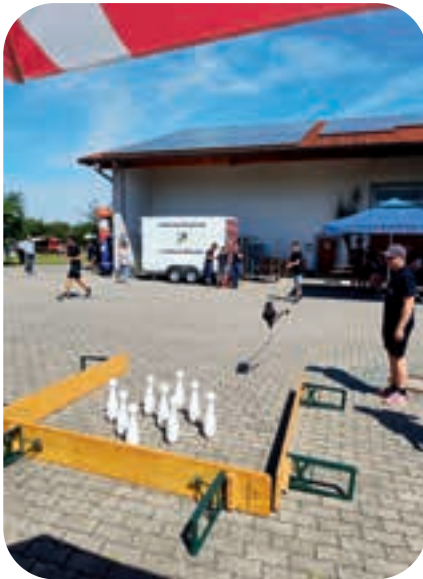
Am Kreisjugendfeuerwehrtag galt es Geschick zu beweisen.

werden von mehreren Alarmen zu Einsatzübungen unterbrochen. In den realistisch aufgebauten Szenarien können die jungen Mitglieder das Gelernte des Ausbildungsjahres praktisch anwenden.