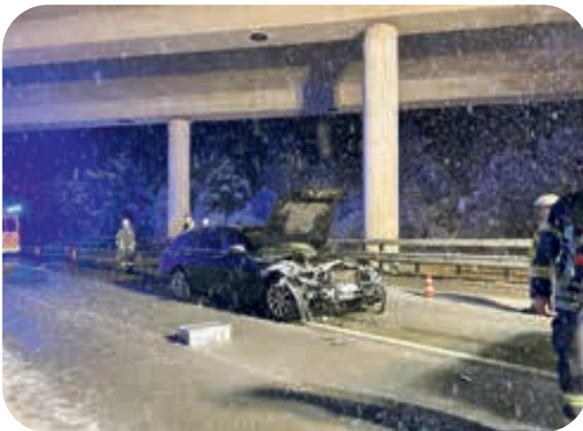
07.01.2024: Auf der Autobahn verunfallte nachts im Schneetreiben ein Personenwagen. Die fünf Insassen wurden leicht verletzt und von den First Respondern der Feuerwehr versorgt.

eingesetzt. Die Ottobrunner saugten mit der Mineralumfüllpumpe das Öl-Wasser-Gemisch aus dem Keller eines Einfamilienhauses und senkten mit Tauchpumpen den Wasserspiegel, um an den Raum mit den Heizöltanks zu gelangen. Die Tanks waren aufgeschwommen, hatten sich verkeilt und waren Leck geschlagen. So konnte das Öl auslaufen. Diese Arbeiten – sowie bei einem Nachbarhaus – setzten