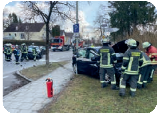
13.02.2024: Ein eCall aus einem Personenwagen führte zum Einsatz an der Kreuzung der Drosselstraße mit dem Ranhazweg. Es war zu einem Zusammenstoß von zwei Fahrzeugen gekommen.