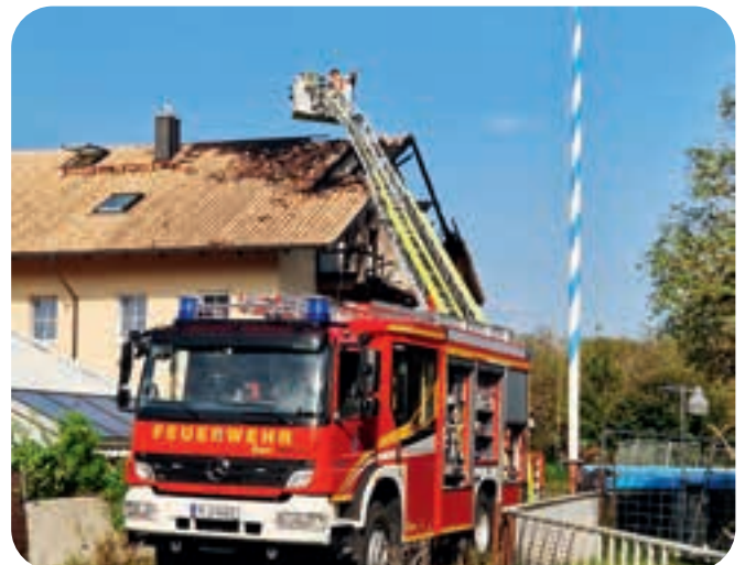
04.09.2024: Die Ottobrunner Feuerwehr unterstützte mit Löschfahrzeug und Drehleiter bei der Bekämpfung eines Dachstuhlbrands in Siegersbrunn.