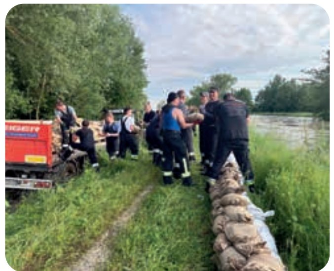
02.06.2024: Bei Vohburg musste der Deich entlang der Donau mit Sandsäcken erhöht werden. Die Ottobrunner Feuerwehr half mit.