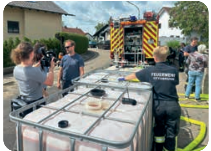
05.06.2024: Eine Journalistin des ZDF ließ sich für eine Kindersendung die Arbeit der Ottobrunner Feuerwehr in Baar erklären.