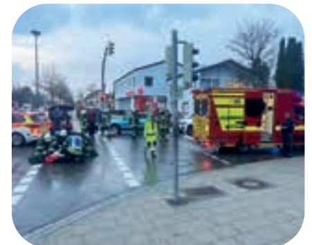
21.03.2024: Eine Autofahrerin saß leblos in ihrem Fahrzeug. Die Rettungskräfte reanimierten sie erfolgreich.

Für großen Unmut bei allen Einsatzkräften sorgte das Verhalten mancher Autofahrer. Es gab keine Rettungsgasse. Mühsam kämpften sich die Einsatzkräfte durch den Stau auf den vier Fahrspuren. Durch Spurwechsel oder Befahren der Rettungsgasse schloss sich nach fast jedem Einsatzfahrzeug die Gasse wieder. So ging nicht nur viel Zeit auf der Anfahrt verloren, sondern es erhöhte auch die Anspannung der Einsatzkräfte, die aus den Rückmeldungen von der eingeklemmten Frau und den um ihr Leben ringenden Kleinkindern wussten. Mehrfach beobachteten Einsatzkräfte, dass aus den vorbeifahrenden Fahrzeugen die Unfallstelle gefilmt und fotografiert wurde. Um die Verletzten und die Rettungskräfte vor den Blicken der Gaffer zu schützen, wurde eine Sichtschutzwand aufgebaut. Diese wird für solche Zwecke in einem Einsatzfahrzeug mitgeführt.