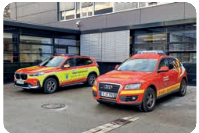
Zum Jahresanfang gab es neue First Responder-Fahrzeuge. Der BMW löste den 13 Jahre alten Audi ab.