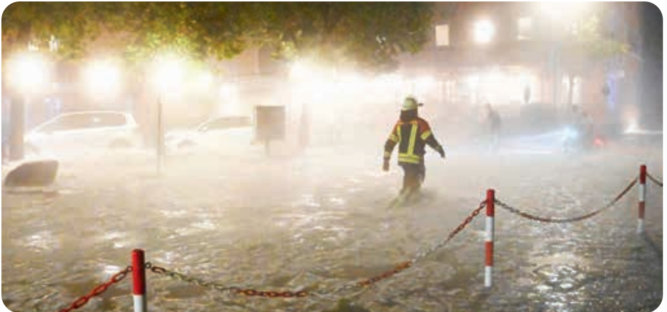
12.07.2024: Starker Regen und heftiger Hagelsturm überfluteten in Höhenkirchen-Siegertsbrunn die Straßen.

Zum Hochwassereinsatz, nämlich zur Sicherung von Ortschaften vor den steigenden Wasserständen, waren Anfang Juni Feuerwehren aus dem Landkreis an der Donau eingesetzt gewesen. Ab dem 04.06.2024 fuhrn mehrere Tage lang Hilfskontingente aus dem Landkreis München in den Landkreis Pfaffenhofen an der Ilm. In der Ortschaft Baar war in Folge eines Dammbuchs eine Wohnsiedlung