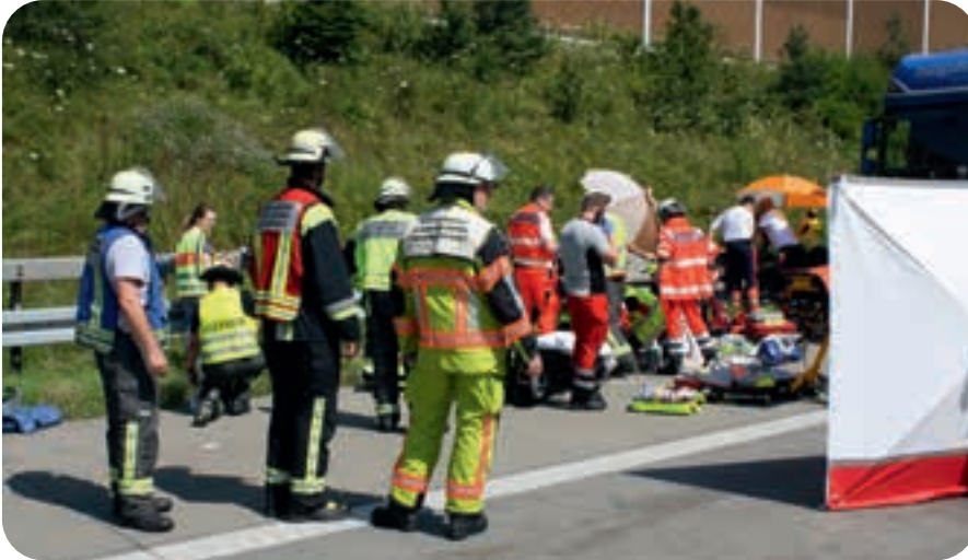
15.07.2024: Entlang der Leitplanke versorgten der Rettungsdienst und die First Responder der Feuerwehren Hohenbrunn und Ottobrunn die acht Verletzten. Ersthelfer spendeten Schatten.

kamen First Responder, Rettungswagen und Notarzt hinzu. Den Rettungskräften gelang es, bei der Frau wieder eine eigenständige Herzaktivität herzustellen, sodass sie in ein Münchner Krankenhaus kam. Die Feuerwehr errichtete zudem eine Sichtschutzwand, sperrte den Kreuzungsbereich und regelte den Verkehr.