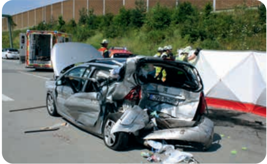
15.07.2024: In diesem Pkw befanden sich zwei Erwachsene und vier Kinder. Fünf der sechs Insassen wurden schwer und schwerst verletzt.

Einen ganzen Haufen Schutzengel hatte eine ältere Frau am 21.03.2024. Feuerwehrkameraden, die von einer Besprechung nach Hause gingen, wunderten sich über einen Pkw, der an der Ottostraße Kreuzung Rosenheimer Landstraße nicht weiterfuhr, obwohl die Ampel grün zeigte. Sie erkannten, dass die Fahrerin bewusstlos über dem Lenkrad zusammengebrochen war. Um sie aus dem Auto herauszuholen, schlugen die Feuerwehrleute die hintere Seitenscheibe ein. Da keine Atmung und kein Puls mehr vorhanden waren, zogen die Ersthelfer sie aus dem Fahrzeug und begannen sofort mit der Reanimation. Dabei unterstützte sie der Fahrer des dahinterstehenden Pkw. Er war früher Mitglied der Ottobrunner Feuerwehr gewesen und im Rettungsdienst beschäftigt. Nach Absetzen des Notrufs