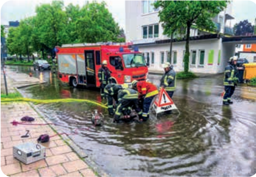
01.06.2024: An mehreren Stellen, wie hier in der Ottostraße, konnte das Wasser nach den starken Regenfällen nicht ablaufen.

Ein Liter Öl verunreinigt eine Million Liter Trinkwasser. Daher ist es wichtig, dass ausgelaufener Treibstoff abgebunden wird, bevor er ins Erdreich eindringen kann. Die Ottobrunner Feuerwehr kam mehrfach auf der Autobahn und im Ortsgebiet zum Einsatz, wenn nach Verkehrsunfällen Motoröl, Benzin oder Diesel aus den beschädigten Fahrzeugen austrat. Besonders in Erinnerung bleiben wird das Jahr 2024