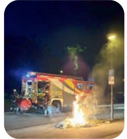
12.02.2024: Nachts steckten Brandstifter Abfallsäcke in der Rosenheimer Landstraße in Brand.

niemand. Weil es sich um einen Brandanschlag auf den Fuhrpark einer Firma handelte, übernahm die Münchner Kriminalpolizei die Ermittlungen. Um 05.04 Uhr rückte die Feuerwehr wieder ein. Über eine Stunde lang waren die Einsatzkräfte damit beschäftigt, die Einsatzbereitschaft wieder herzustellen.