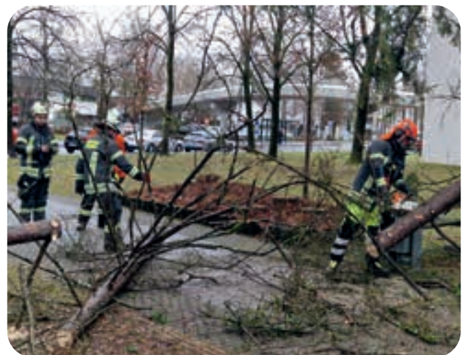
22.12.2024: Einsatzkräfte beseitigten mit der Kettensäge einen im Wintersturm umgeknickten Baum.