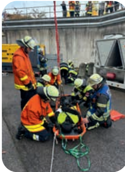
Einsatzübung Menschenrettung am BF-Tag mit einem Übungsdummy.

Diepenbroek: Neben den Jugendübungen waren wir unter anderem mit zwei Teams auf dem Kreisjugendfeuerwehrtag vertreten, haben einen erweiterten Erste Hilfe-Kurs absolviert, Freizeitaktivitäten in den