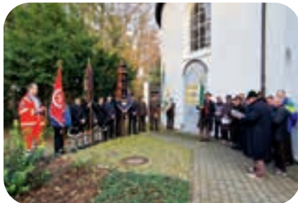
November: Am Volkstrauertag gedachten die Vereine den Gefallenen und Vermissten an der Tafel an der Kirche St. Otto.