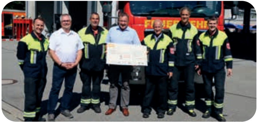
Große Freude über die großzügige Spende der Ottobrunner Firma TE.

Zum Jahresende haben Sie Post von der Feuerwehr in Ihrem Briefkasten gefunden. Die Spendenbriefe unter dem Motto „Unsere Freizeit für Ihre Sicherheit“ haben die Mitglieder der Ottobrunner Feuerwehr ausgetragen. Wir konnten dadurch einige neue Fördernde Mitglieder gewinnen. Sie