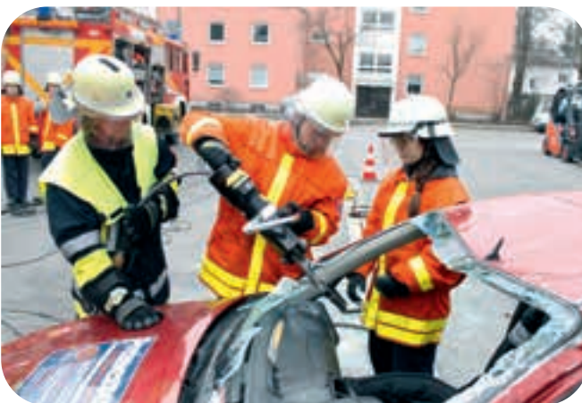
Bei einer Übung durchtrennt die Rettungsschere den Fensterholm.

Seit 2015 setzt die Ottobrunner Feuerwehr auf die nächste Generation. Der große Fortschritt kommt durch die Akkutechnik. Nun steckt ein Hochleistungsakku im Gerät und die unhandlichen Hydraulikschläuche stören nicht mehr bei den Rettungsarbeiten. Laute und von zusätzlichem Personal zu bedienende Stromerzeuger und Hydraulikaggregate sind nicht mehr nötig.