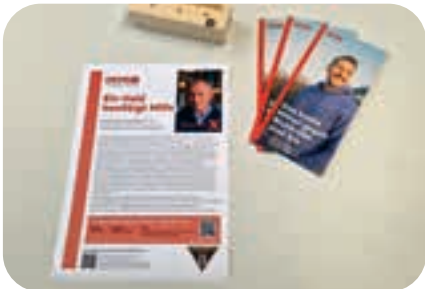
November: Weil ein Kamerad der BF München an Blutkrebs erkrankte, fand auch in Ottobrunn eine Registrierungsaktion statt.