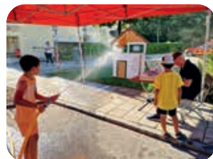
September: Die Spritzwand bei der Feuerwehr besucht fast jedes Kind am Ottostraßenfest.