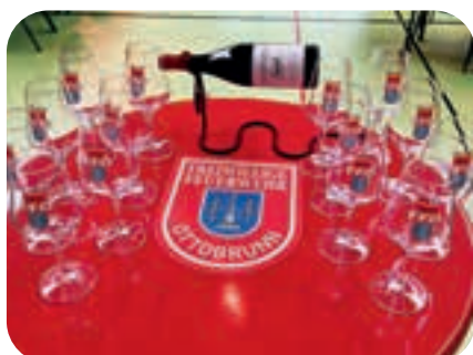
April: Auf dem Südtiroler Weinfest schenkte die Feuerwehr Weine aus unserer Partnergemeinde Margreid aus.