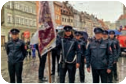
September: Augsburg, die älteste Feuerwehr in Bayern, feierte ihr 175-jähriges Jubiläum. Wir waren dabei.