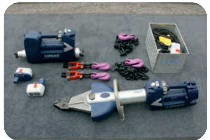
Hydraulischer Rettungssatz mit Akkutechnik: Kombispreizer, der spreizen und schneiden kann (vorne) und Rettungszylinder (hinten). Ketten, Akkus und Ladekabel gehören als Zubehör dazu.