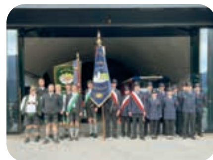
März: Der Burschenverein und die Feuerwehr führen zum Gertraudfest in die Südtiroler Partnergemeinde Margreid.