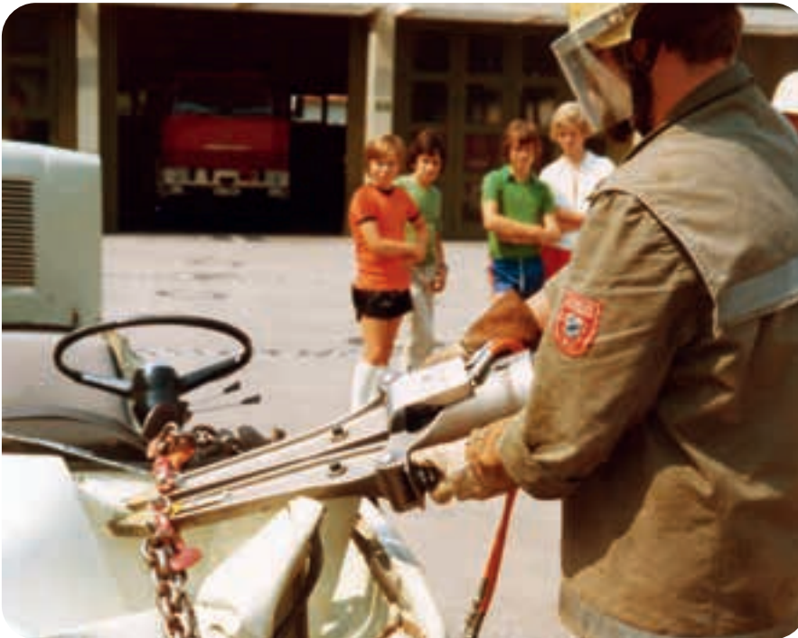
Vorführung des Ziehens eines Lenkrades mit dem ersten 1975 beschafften Rettungsspreizer.

Verkehrsunfall – Person eingeklemmt! Wie bekommt man den Verletzten aus dem zerstörten Auto heraus? Bis vor 50 Jahren stellten diese Rettungsarbeiten für die Verunfallten und die Einsatzkräfte eine Tortur dar. Das Brennschneidgerät erhitze das Blech und seine Flamme gefährdete die Verletzten. Der Motortrennschleifer verursachte zudem infernalisches Lärm und starken Funkenflug. Die Brandgefahr war sehr hoch, wenn Kraftstoff ausgelau-