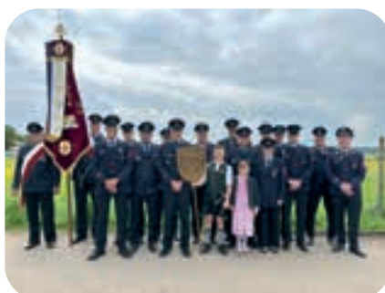
Mai: Die Feuerwehr Brunthal feierte Jubiläum und wir feierten mit einer großen Abordnung mit.