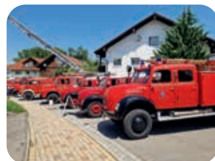
Juli: An der Oldtimerrundfahrt in Börwang nahm unser altes Tanklöschfahrzeug TLF 16 von 1958 teil.