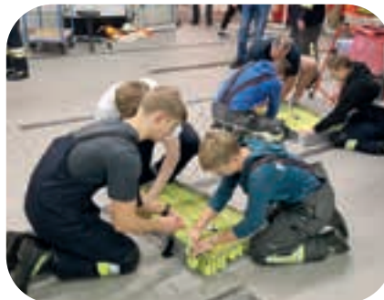
Viele Hände sind nötig, um die Schlauchtragekörbe zu bestücken.

tos, entwirft die Beiträge für die Social-Media-Kanäle Facebook und Instagram sowie für die Homepage, bespricht diese mit dem Einsatzleiter und veröffentlicht sie. Damit endet die Büroarbeit noch nicht, denn jeder Einsatz wird von den Schriftführern in der EDV geprüft und dann von den Kommandanten zur finalen Ablage freigegeben. Je nach Einsatzart und Tätigkeit sind die zur Rechnungsstellung benötigten Daten zu Personal, Fahrzeugen und Material für die Gemeindeverwaltung aufzubereiten und an das Ordnungsamt weiterzuleiten. Dieser zusätzliche Zeitaufwand, den die Mitglieder der Feuerwehr ebenso ehrenamtlich erbringen, gehört ganz selbstverständlich zu ihrer Aufgabe dazu. Denn nach dem Einsatz ist vor dem Einsatz. Und der nächste Alarm kann jederzeit kommen.