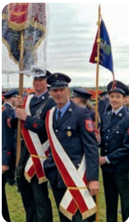
Juli: Mit der Fahne und dem Jugendwimpel nahmen wir am Festzug zu 150 Jahre Feuerwehr Grasbrunn teil.