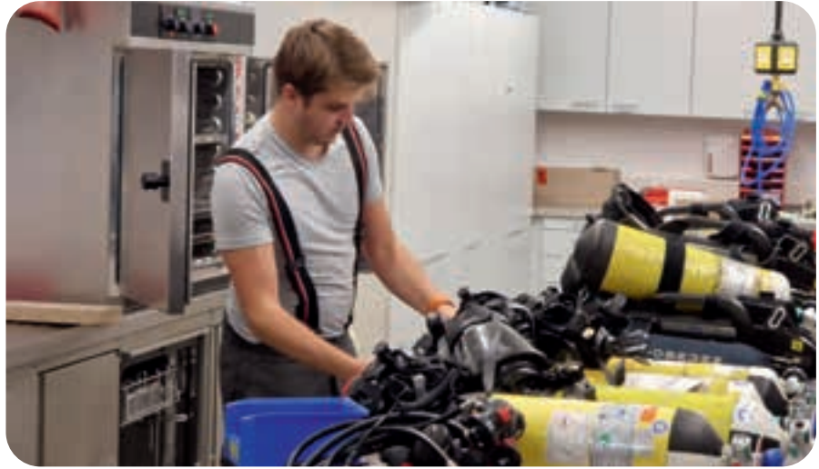
Aufgabe der Atemschutzwerkstatt ist es, die Geräte wieder einsatzbereit zu machen.

Die First Responder kontrollieren ihre Ausrüstung und ersetzen, was sie an Verbands- und Verbrauchsmaterial benötigen. Diejenigen, die ein Atemschutzgerät aufgesetzt hatten, wechseln die Pressluftflaschen und die Maske, reinigen ihr Gerät und prüfen die Funktionsfähigkeit bevor sie es wieder im Fahrzeug verlasten. Das Team der Atemschutzwerkstatt füllt die Atemluftflaschen, wäscht die Masken, tauscht die Ersatzteile, prüft diese und dokumentiert ihre Arbeit sorgfältig. Das Auffüllen leerer Trinkwasserkästen ist wichtig, damit am Einsatzort Getränke für die erschöpften und durstigen Einsatzkräfte bereitstehen. Die Maschinisten rangieren ihre Fahrzeuge zur Zapfsäule an der feuerwehreigenen Dieseltankstelle und in der Fahrzeughalle erfolgt das Nachfüllen des Löschwassers. Zum Abschluss führt der Maschinist die Trockensaugprobe durch und überzeugt sich von der Funktionsfähigkeit der Pumpe. Bei den Aggregaten – wie den Stromerzeugern, Trennschleifern, Kettensägen oder Hochleistungslüftern – werden die Füllstände von Kraftstoff und Öl kontrolliert und nachgefüllt. Einsatzkräfte bestücken die leer geräumten Schlauchfächer mit B- und C-Schläuchen, füllen die Schlauchtragekörbe auf und legen die Schlauchpakete neu. Um die Reinigung und Prüfung des be-