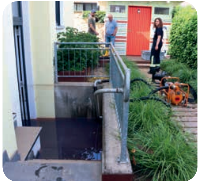
04.06.2024: Das Gemisch aus Heizöl und Wasser steht im Keller. Mit der Mineralölumfüllpumpe wird die oben schwimmende Ölschicht abgesogen.