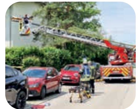
06.06.2024: Mit der Drehleiter holte die Feuerwehr eine erkrankte Person schonend aus ihrer Wohnung.