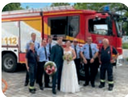
Juli: Gratulation einem Feuerwehrhepaar zur Hochzeit, denn sie haben sich bei der Ottonbrunner Feuerwehr kennen gelernt.