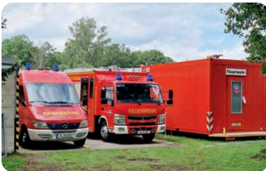
Einige Monate lang standen zwei Feuerwehrfahrzeuge bei der Schule 2.

Klas: Auf dem Gelände der Schule 2 haben wir das Mittlere Löschfahrzeug und einen Mannschaftstransporter stationiert. In dem Container daneben hing die Schutzkleidung derjenigen Einsatzkräfte, die östlich von der Bahnlinie wohnen oder dort ihren Arbeitsplatz haben.