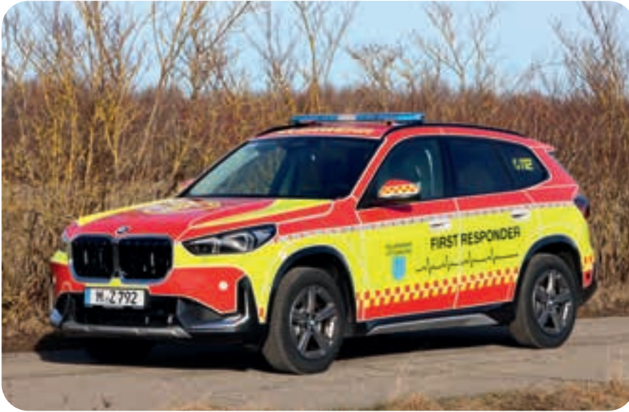
Im Straßenverkehr fallen die neuen First Responder Fahrzeuge der Ottobrunner Feuerwehr auf.

Seit Jahresanfang fahren zwei neue, auffällig in gelb und rot beklebte Feuerwehrfahrzeuge durch Ottobrunn. Die beiden BMW X1 sind mit First Responder beschriftet. Bei lebensbedrohlichen Erkrankungen oder Verletzungen entscheidet schnelle medizinische Hilfe oftmals über Leben und Tod. So sinkt bei einem Herzinfarkt mit jeder Minute ohne medizinische Hilfe die Überlebenschance um zehn Prozent. Die Zeit bis zum Eintreffen des Rettungswagens oder Notarztes sollen die First Responder überbrücken. Damit keine Zeit beim Ausrücken verstreicht, haben die beiden diensthabenden Helfer