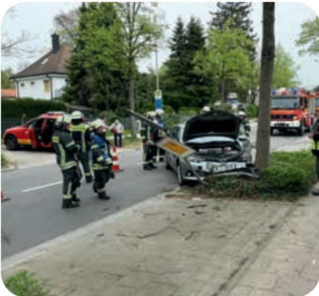
9.4.2024: Auf der Unterhachinger Straße prallte ein älterer Fahrer mit seinem Wagen gegen einen Baum. Die Feuerwehr schaltete das Hybridfahrzeug stromlos.

und Nass-Saugern aus den Kellern. Das Löschfahrzeug LF 20 war etwa zwei Stunden lang damit beschäftigt, die unter Wasser stehende Unterführung der Luitpoldstraße am S-Bahn-Haltepunkt Wächterhof auszupumpen. Und die Drehleiter wurde um 03.31 Uhr angefordert, um an einem Einkaufsmarkt die Einsatzkräfte vom THW zu unterstützen. Diese deckten auf dem Dach die vom Hagel zerschlagenen Plexiglaskuppeln ab, damit es nicht weiter in das Gebäude hineinregnete. Um 05.51 Uhr kamen die letzten beiden Einsatzkräfte aus Ottobrunn wieder nach Hause zurück.