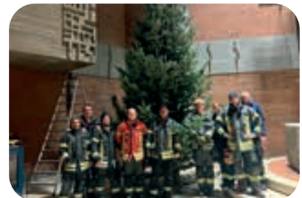
Dezember: Wie in jedem Jahr stellte die Feuerwehr den Weihnachtsbaum in der Michaelskirche auf.