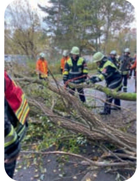
Einsatzübung: Ein über eine Straße gestürzter Baum muss beseitigt werden.

Diepenbroek: Als Jugendgruppe dürfen natürlich die gemeinsamen Freizeitaktivitäten nicht zu kurz kommen. Auch bei den vielen Veranstaltungen des Feuerwehrvereins wirken die Mitglieder der Jugendgruppe regelmäßig mit.