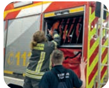
Zum Schluss kommen die Schläuche wieder in die Löschfahrzeuge.