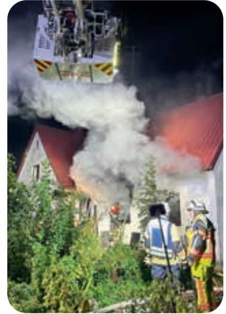
12.09.2024: In Neubiberg suchten die Atemschutztrupps nach einer im brennenden Haus vermissten Person.

Ein Hinweis: Die Pflicht zur Montage von Rauchwarnmeldern in Bayern setzte 2013 ein. Viele Melder haben eine eingebaute Langzeitbatterie mit 10-jähriger Lebens-