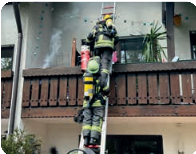
11.04.2024: Mit Steckleitern kletterten zwei Feuerwehrleute auf einen Balkon. Dort rauchte es aus einem Blumenkübel.

Bereits eine Woche später fuhren 51 Ottobrunner zu einem Wohnhausbrand in der Neubiberger Waldstraße. Am Abend des 12.09.2024 standen mehrere Räume im Erdgeschoss in Brand, das Feuer breitete sich auf das Dachgeschoss aus. Zwei Bewohner konnten sich selber in Sicherheit bringen, gaben aber an, dass noch eine Person vermisst wird. So suchten die Feuerwehren aus Neubiberg, Ottobrunn und Putzbrunn unter Atemschutz nach ihr im brennenden Gebäude, bis die Polizei